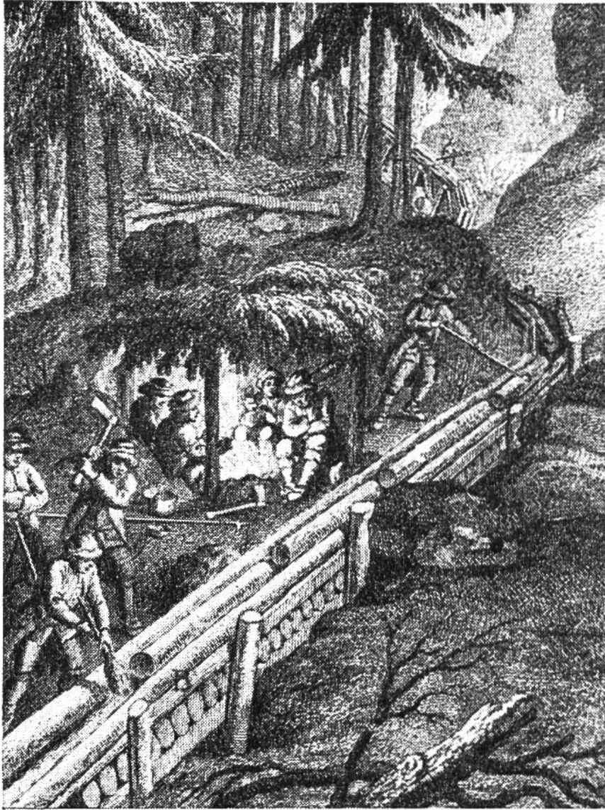
Holzriesen (Holzrutsche) in den Bergen. Nach einem alten Stich.