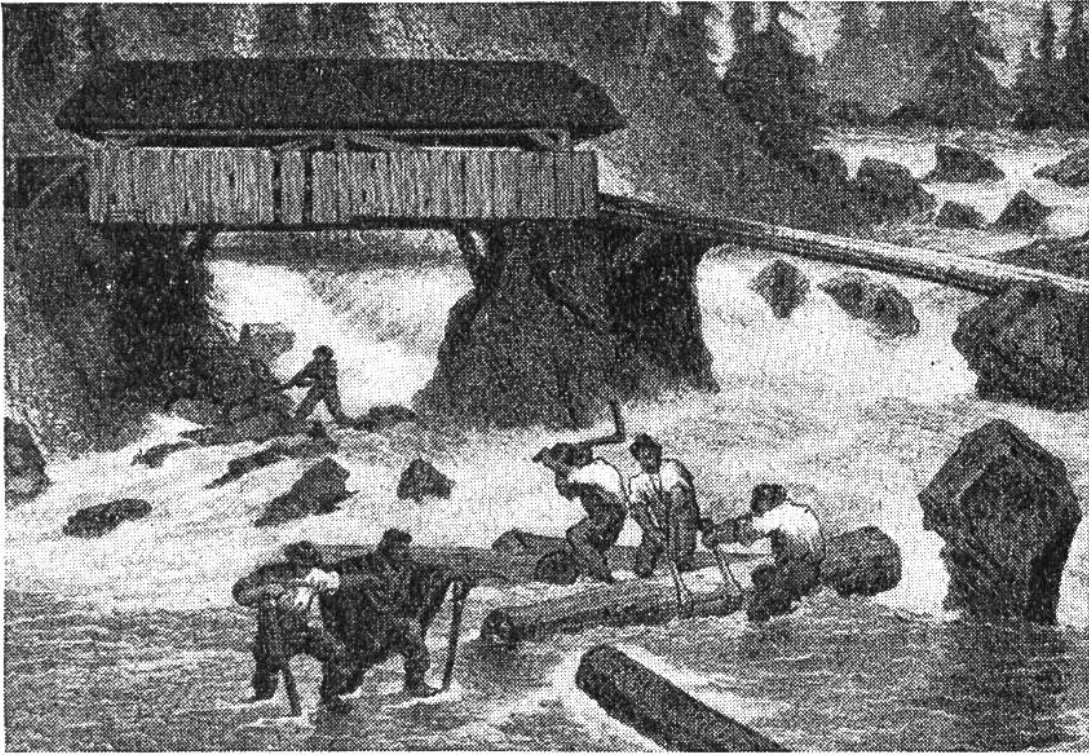
Wildflößen von Sägehölzern an der Sense. Nach einem alten Stich.

mässigen Holzlieferung an Bergwerksbetriebe verwendet wurden, sind heute aus unseren Bergtälern verschwunden. Beim Holzreisen wie bei der Wildflösserei oder der «Trift» (so heisst der Transport einzelner Holzstücke durch das Wasser) wird das Holz durch das häufige Anschlagen stark beschädigt. Die Triftflösser rechnen mit einem mittleren Holzverlust von 10%. Früher soll dieser Verlust noch grösser gewesen sein. So konnte die Stadt Zürich in den Jahren 1616–1619 am Rechen der Sihl nur zwei Fünftel aller von den Schwyzern im obern Sihltal abgekauften Scheiter herausfischen. Die restlichen drei Fünftel gingen durch Hochwasser, Hängenbleiben, Untersinken und Diebstahl unterwegs verloren.