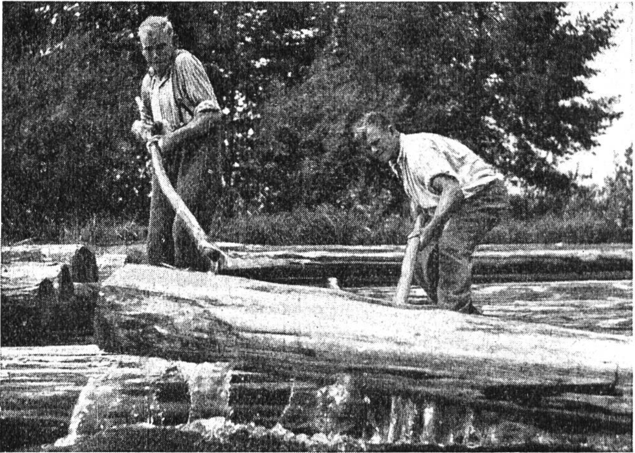
Mühsam heben die Flößer die zweite Lage Stämme auf das von ihnen selbst erstellte Floss.

gerei oder einer fahrbaren Strasse – haben die Flößer einen Rechen errichtet, der das Weiterwandern des Holzes verhindert. Im felsigen Bergbach verfängt sich das Holz leicht an allen möglichen Hindernissen. Damit keine Stauungen entstehen und alles nachfolgende Holz leicht passieren kann, müssen die Flößer mit ihren langen, zweizinkigen Flößerhaken die festgeklemmten Scheiter, Stangen und Trämel auf dem ganzen Talweg immer wieder lösen. Die meisten Flößer lieben ihren gefährlichen Beruf. Geschickt springen sie von Block zu Block oder turnen waghalsig auf zwei Stämmen quer über den stiebenden Bach, dessen Tücken sie genau kennen und daher wissen, wie sie ein festgefahrenes Stück Holz im reissenden Wasser wieder flott machen müssen, damit es sicher zu Tale gleitet.