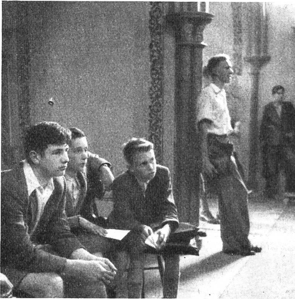
Neuntklässler lauschen ergriffen den Orchesterklängen.

wieviel Freude, wieviel Ergriffenheit aus ihnen spricht? – Da ist der kleine Flötist von sechs Jahren, der seinem Schwesterchen auf der Blockflöte vorspielt. «Kuckuck, Kuckuck! Suseli, guck, guck!» Und Suseli hat gut zugehört, damals. Jetzt spielt es selber schon Geige und sein grosser Bruder die Querflöte. – Oder hättet ihr euch vorgestellt, dass es so lustig zugeht wie auf dem zweiten Bild, wenn euch im Radio mitgeteilt wird: «Hört zu, jetzt folgt die Kindersymphonie von Haydn, gespielt von lauter Kindern»? Da trommeln und trompeten sie, schlagen den Triangel, streichen Geige und Bratsche, und eines darf wiederum den Kuckuck spielen. – Und auf den andern Bildern? Da dürfen die Grösseren ein von der Schuldirektion veranstaltetes Konzert anhören, das nur um ihretwillen aufgeführt wird. Alle Neuntklässler bekommen einen schulfreien Vormittag, um Musik zu erleben. Dichtgedrängt füllen sie die geräumige