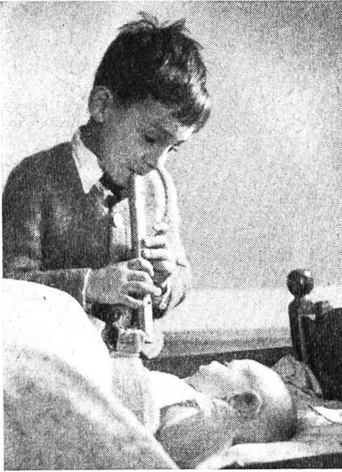
Hörst du, Suseli: Kuckuck, Kuckuck – ruft's aus dem Wald!