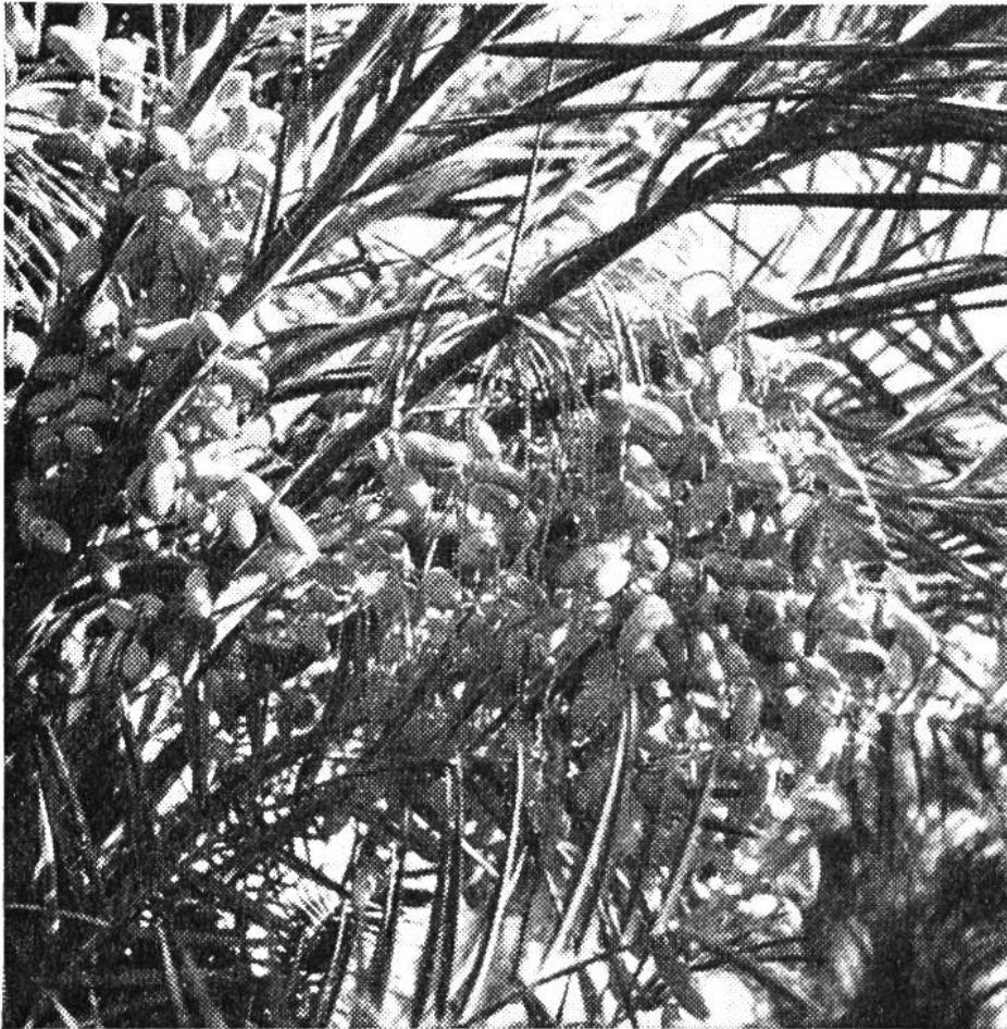
Saftige Datteln am Palmstamm; sie sind bald reif.

weil vom Sudan bis tief in die Waldregionen Mittelafrikas hinein kein Körnchen Salz zu finden ist. Auch der grüne Tee aus China und der einzige Luxus bei den Mahlzeiten der Wüstenbevölkerung, die kleinen Zuckerhüte aus Europa, gelangen mit Kamelkarawanen von Grosskaufleuten in die bescheidenen Oasen. Keine kostspieligen Strassenbauten, Bahntrakte, Bahnhöfe sind hier vonnöten; das Kamel schreitet in gleichmässigem Passgang quer durch das unberührte Sandmeer. Technische Neuerungen müssten von aussen, von Europa oder Amerika kommen; und man weiss nicht im voraus, wie sich die Wüstenbevölkerung dazu stellen würde. Diese ist überaus dünn gesät, so dass es kaum lohnte, moderne mechanische Transportmittel an die Stelle der billigen Karawanen zu setzen. Dazu sind die Wüstenbewohner, die Berber heller und dunkler Hautfarbe, konservativ, am Alten hängend, voll Aberglauben und Misstrauen. Es wären gewiss ebenso wunderliche Rückwirkungen zu erwarten wie bei unseren Urgrossvätern, als diese die erste Eisenbahn sahen. Oder als z. B. in