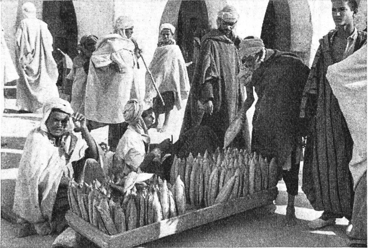
Brotmarkt in der Oase Ouargla. Die Käufer scheinen wählerisch zu sein. Hier kaufen die Männer ein; Frauen sieht man nur verschleiert auf der Strasse.

der heiligen Stadt Mekka das Telephon gelegt werden sollte, musste sich die islamitische Geistlichkeit erst durch praktische Versuche davon überzeugen, dass diese verdächtige Erfindung der Ungläubigen sich nicht sträubte, auch Sprüche des Korans zu übermitteln.