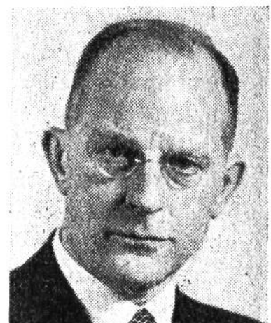
Dr. Hans Streuli von Wädenswil und Richterswil, * 1892, seit 1954 im Amte