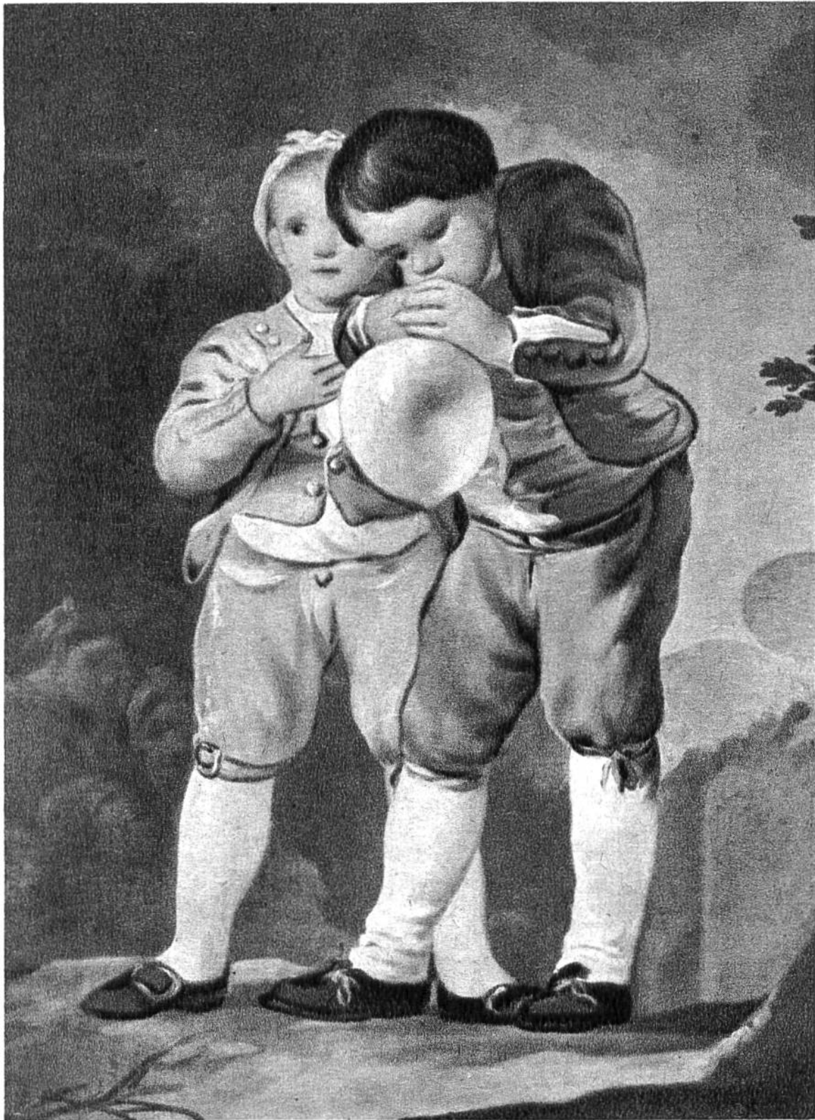
Spielende Kinder, von Francisco Goya, Madrid, 1746 - 1828.