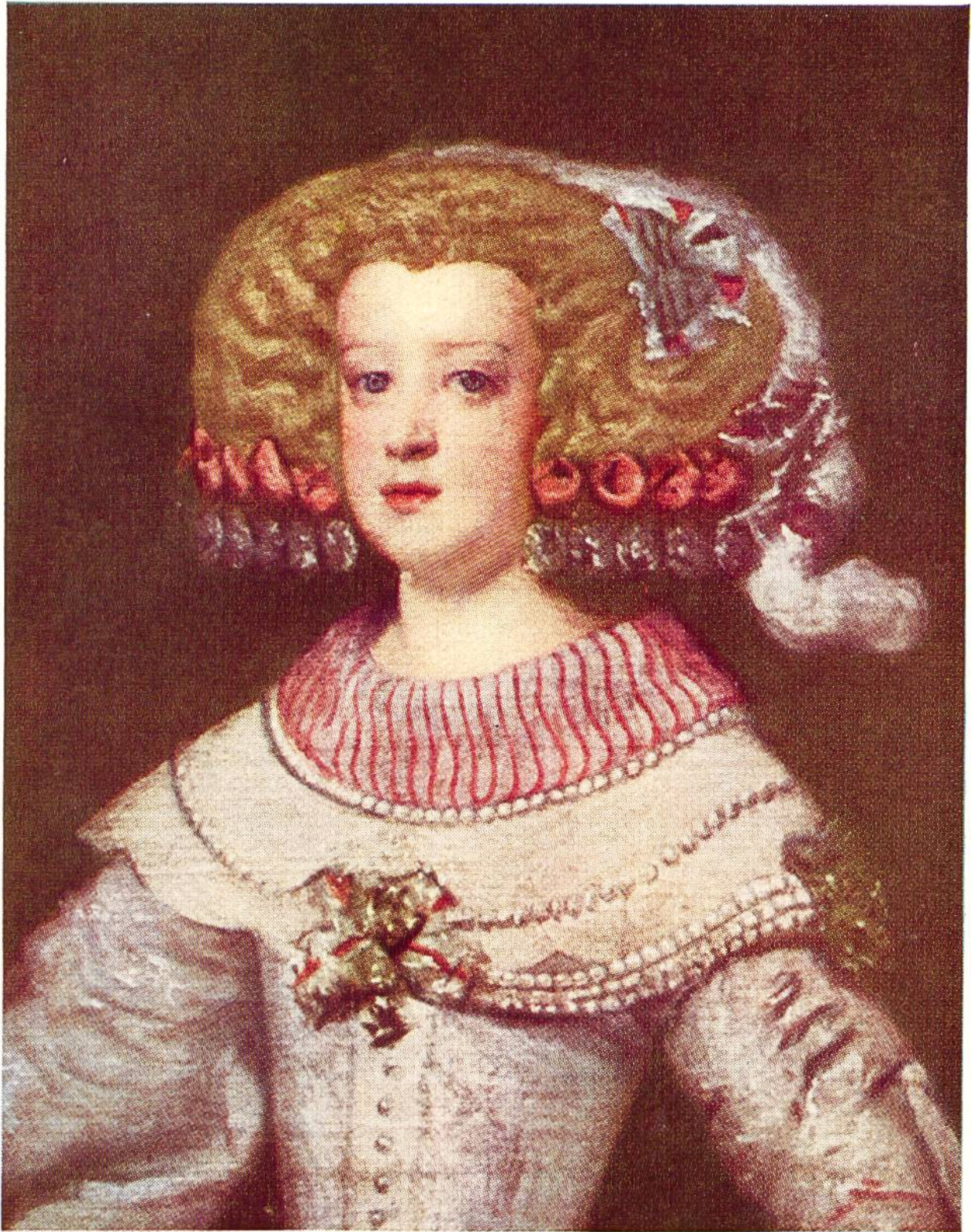
INFANTIN MARIA THERESIA, TOCHTER PHILIPPS IV. VON SPANIEN, SPÄTER GEMAHLIN LUDWIGS XIV. VON FRANKREICH.

Gemälde von Diego Velasquez, Sevilla, 1599–1660.