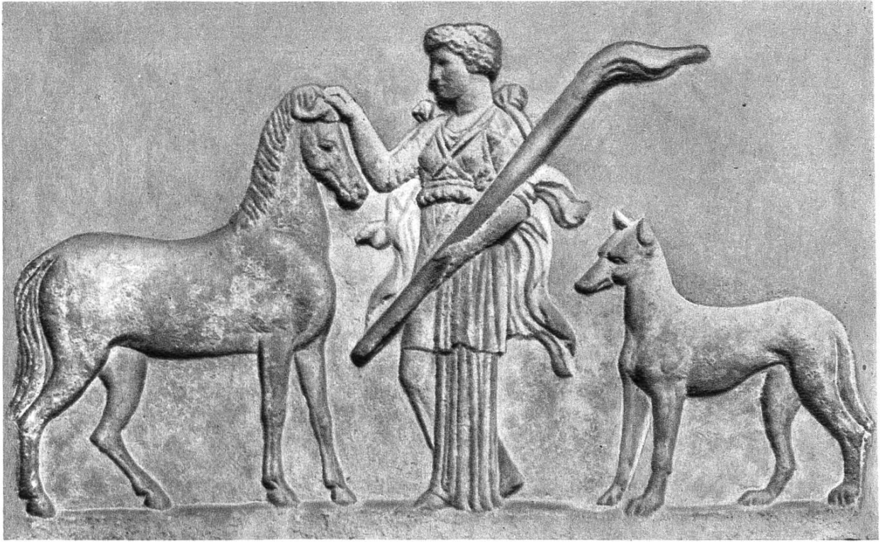
Griechische Göttin Hekate, Marmorrelief aus dem 4. Jahrhundert v. Chr., in Thessalien gefunden.