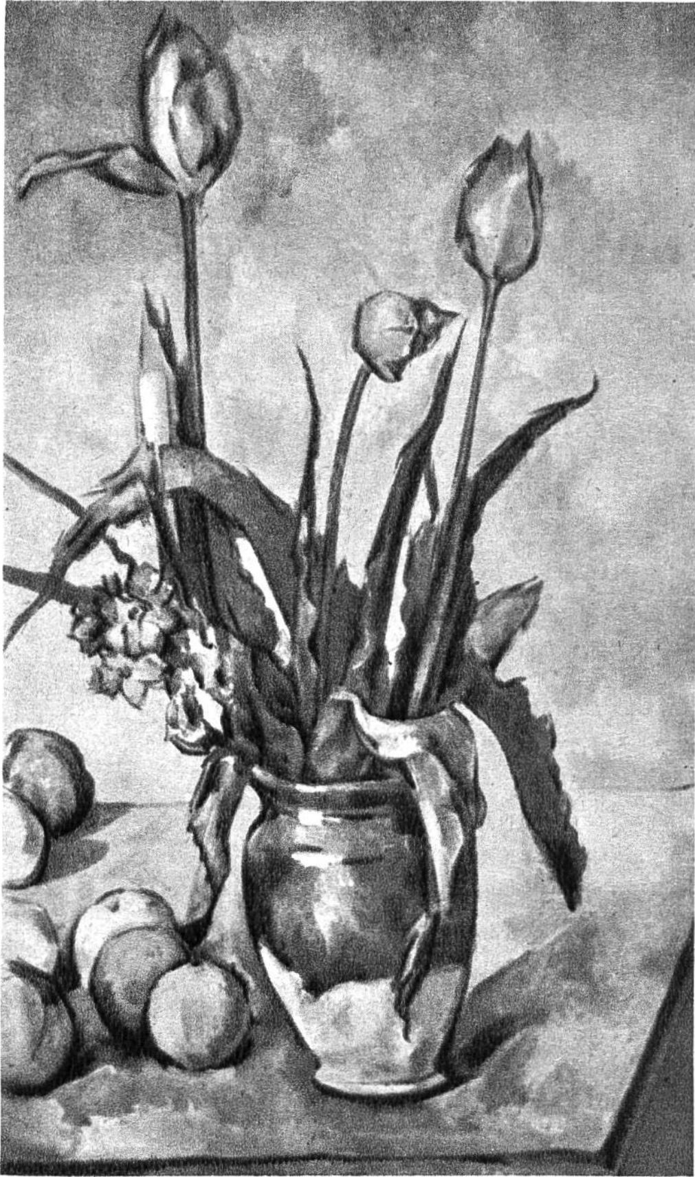
Stilleben, von Paul Cézanne, Aix-en-Provence, 1839 - 1906.