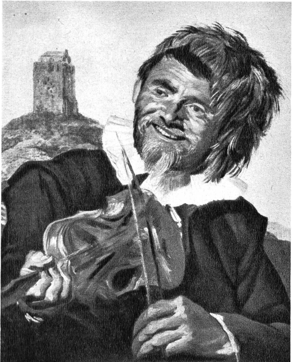
Geigender Fischer am Strand von Zandvoort, von Frans Hals, Haarlem, 1580-1666. (Galerie Thyssen, Lugano.)