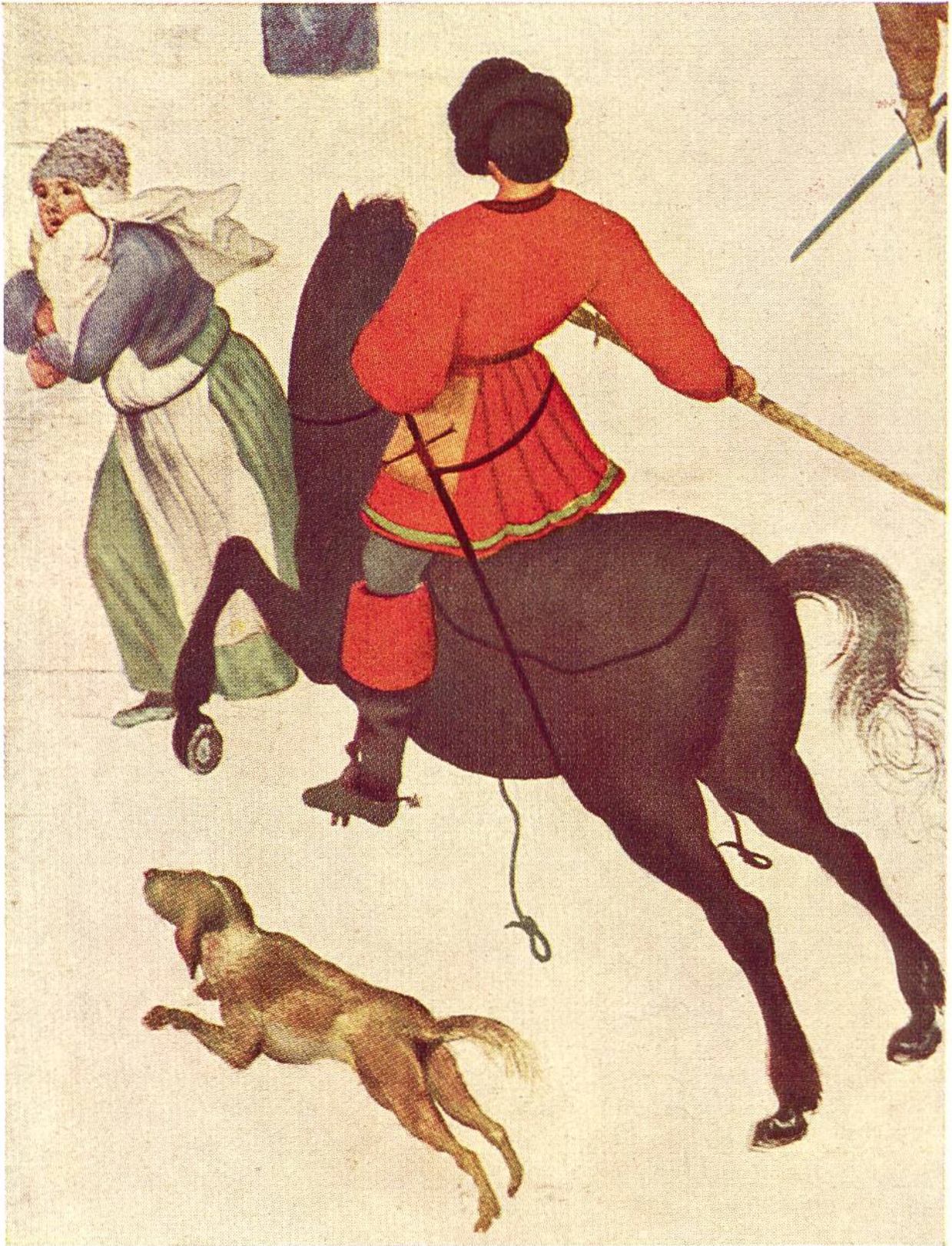
BETHLEHEMITISCHER KINDERMORD (Teilstück), von Pieter Bruegel dem Älteren (genannt Bauernbrueghel), Brüssel, 1525–1569.