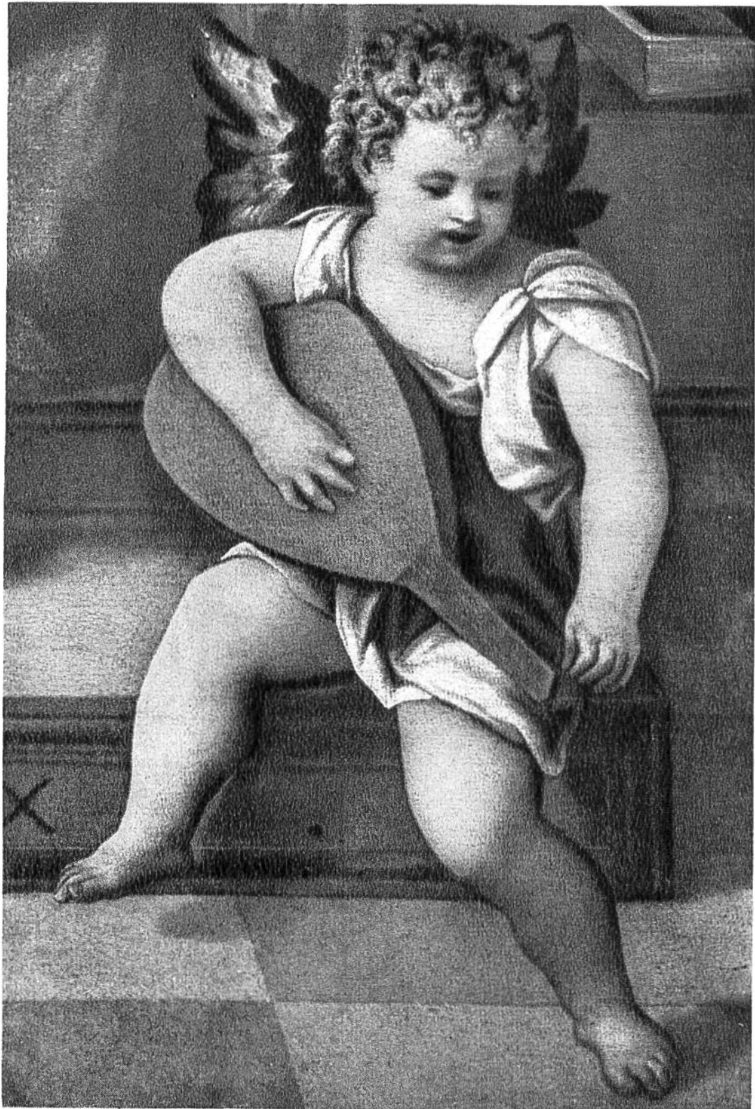
Engel, aus dem Gemälde «der thronende Christus» von Bonifazio Veronese, Venedig, 1491-1553.