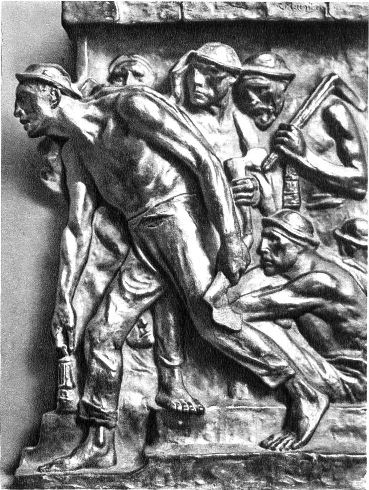
Bergleute nach der Arbeit, Bronzerelief von Constantin Meunier, Brüssel, 1831 - 1905.