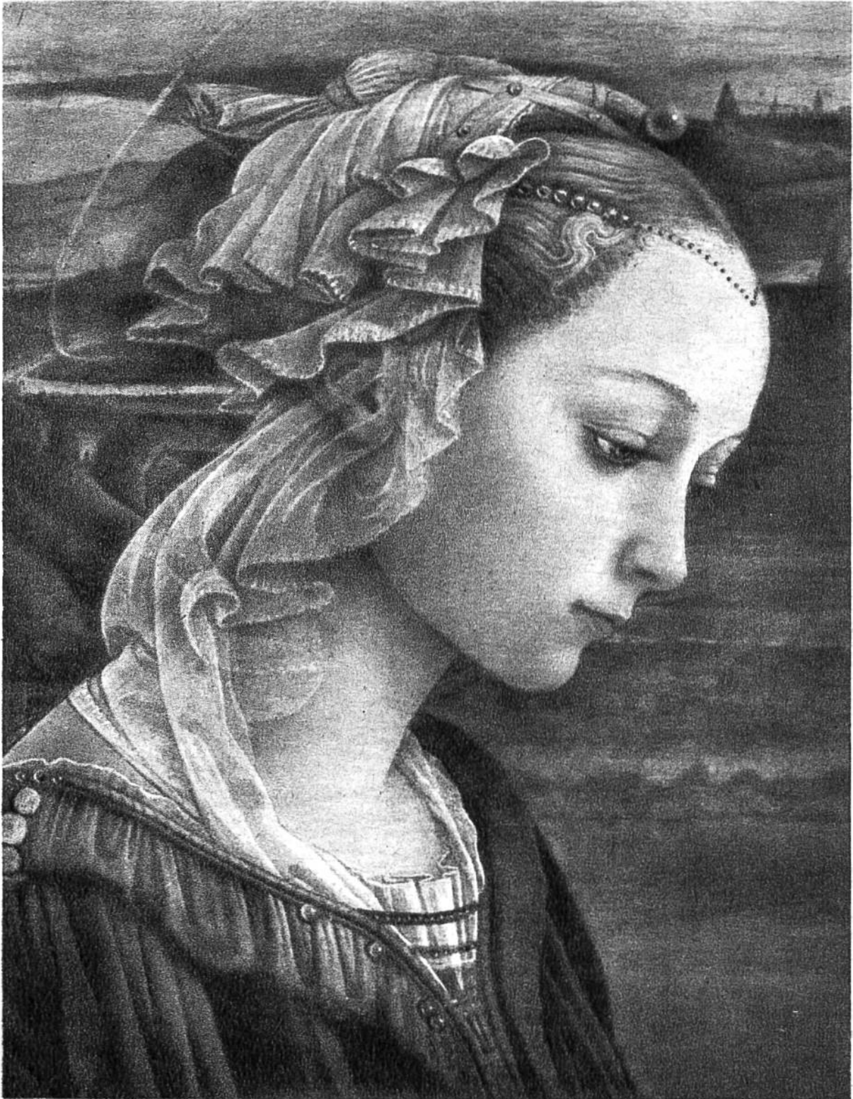
Maria, von Fra Filippo Lippi, Florenz, 1406-1469.