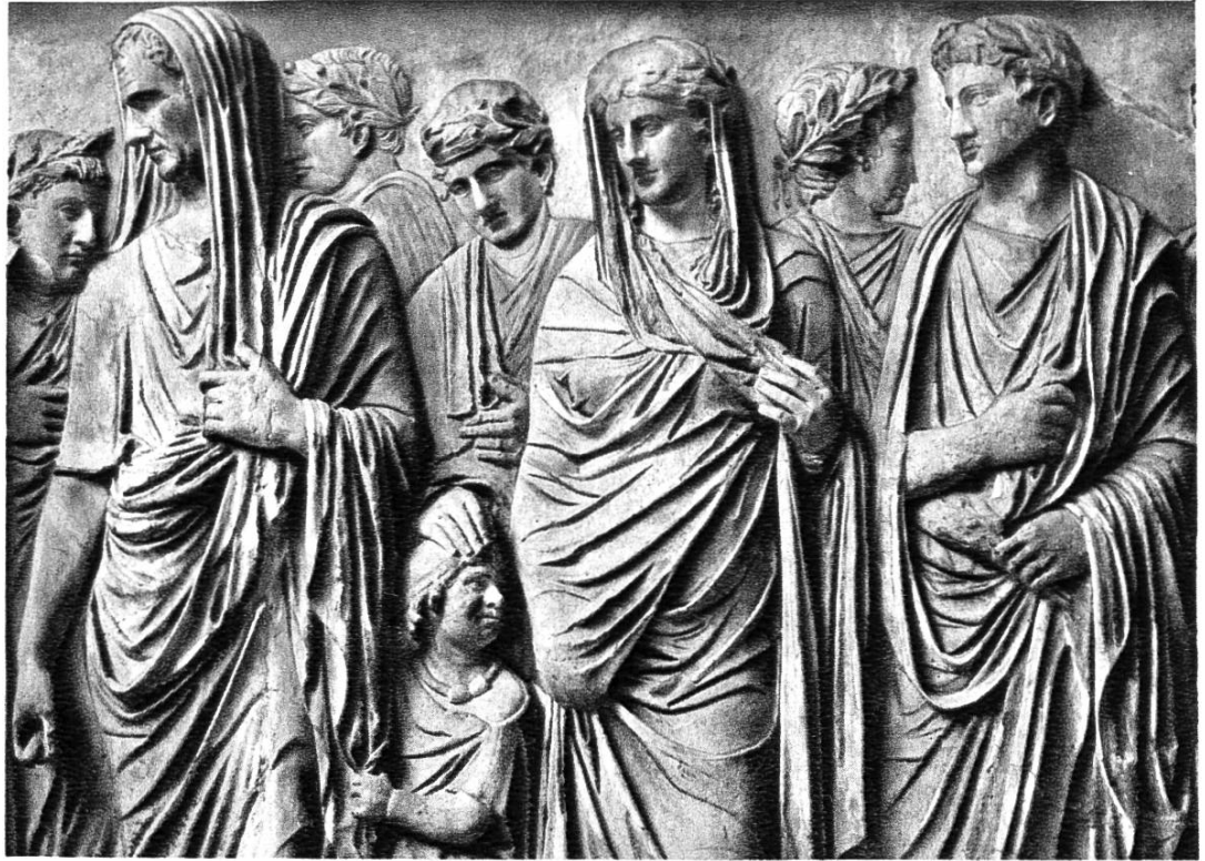
Römische Kaiserfamilie, Relief aus dem 1. Jahrh. v. Chr.