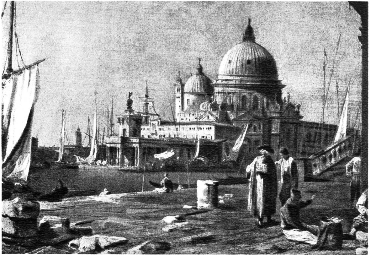
Santa Maria della Salute in Venedig, v. Antonio Canaletto, Venedig, 1697-1768