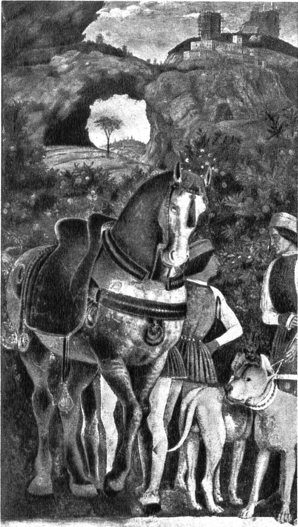
Rückkehr von der Jagd (Teilstück der Fresken in Mantua), von Andrea Mantegna, Mantua, 1431-1506.