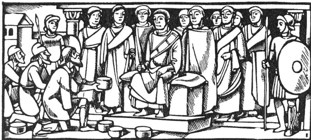
Konstantin der Grosse (306–337) nimmt die Gaben tributpflichtiger Völker entgegen.

oberung Galliens durch Julius Cäsar. 49–45 Bürgerkrieg zw. Cäsar u. Pompejus. Triumvirat. 44 Ermordung Cäsars. 30–476 n. Chr. Rom unter Kaisern. 29 Augustus röm. Kaiser. Blüte der römischen Literatur. Virgil, Ovid, Horaz, Titus Livius. Nach Christus. 9 Der röm. Feldherr Quintilius Varus wird vom Cheruskerfürsten Arminius (Hermann) im Teutoburgerwalde besiegt. 64–311 Zeit der Christenverfolgungen durch verschiedene römische Kaiser. 69 Helvetischer Aufstand, Julius Alpinus. 313 Kaiser Konstantin erhebt das Christentum z. Staatsreligion. 337 Teilung des röm. Reiches. 375 Beginn d. Völkerwanderung.