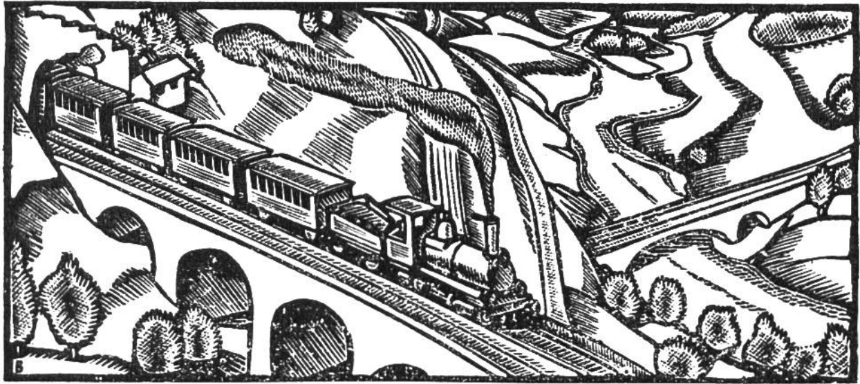
Die 1882 eröffnete Gotthardbahn hat 80 Tunnel und Galerien von zusammen über 46 km Länge und 1234 Brücken und Durchlässe. Sie fährt seit 1920 elektrisch.