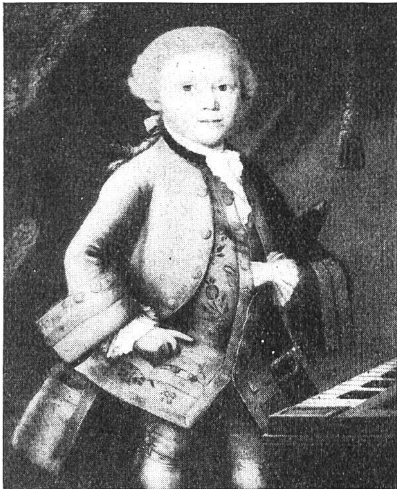
Der junge Mozart im Galakleid. Ölgemälde im Mozart-Museum in Salzburg.