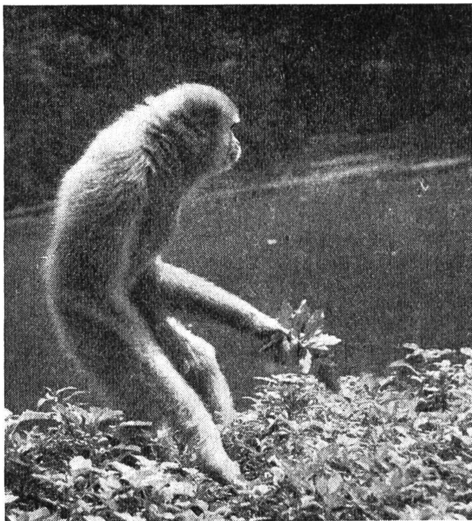
Gibbon beim Sammeln von Blättern am Ufer seiner Insel.

nur für solche, die nicht freiwillig ins Wasser gehen. Zu ihnen gehören z. B. die südostasiatischen Gibbone, jene liebenswürdigen und eleganten Vertreter der vierten Menschenaffengruppe, die ihrerseits acht Arten umfasst. Im Gegensatz zu den übrigen Menschenaffen, also zu Gorilla, Schimpanse und Orang-Utan, bauen die Gibbone keine Schlafnester, sondern übernachten frei im Geäste hoher Bäume sitzend. Für sie sind solche baumbestandene Affeninseln, die rings vom Wasser eines malerischen Weihers umgeben sind, die ideale Unterkunft. Aber auch für den Zoobesucher ist dies die erfreulichste Art der Schaustellung. Durch keinerlei Gitter behindert, kann er die schlanken Gibbone wie kühne Trapezkünstler sich von Ast zu Ast schwingen sehen.