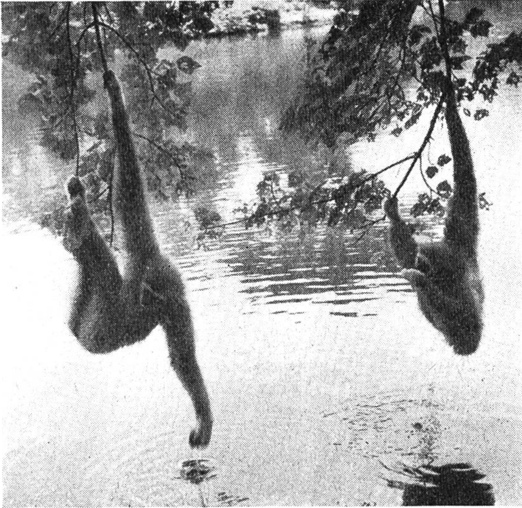
Eine reizende Szene: Trinkende Gibbone auf der Affeninsel des Bronx Zoo.