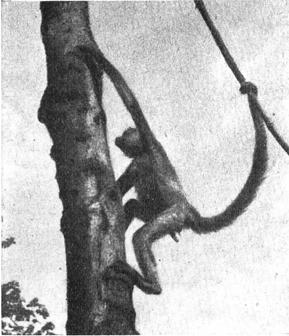
Beim Klettern ist der lange Greifschwanz dem Spinnenaffen eine wichtige Hilfe.

dern so, wie sie es in ihrer Heimat gewöhnt waren: vorsichtig lassen sie sich an einem überhängenden Ast so nahe an die Wasseroberfläche hinunter, dass sie mit einer Hand Wasser schöpfen und in kleinen Portionen zum Mund führen können. Im Freien haben sie bei diesem senkrechten Einblick ins Wasser die Möglichkeit festzustellen, ob da nicht etwa ein Krokodil lauernd in der Tiefe liegt und überraschend nach ihnen schnappen könnte. Solche Wasserstellen sind ja in den Tropen oft von allerlei Raubtieren umlagert, welche es auf durstige Beutetiere abgesehen haben.