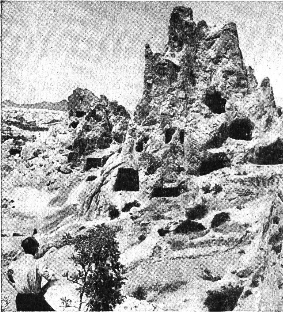
Noch heutzutage sind viele dieser Höhlen von Hirten bewohnt