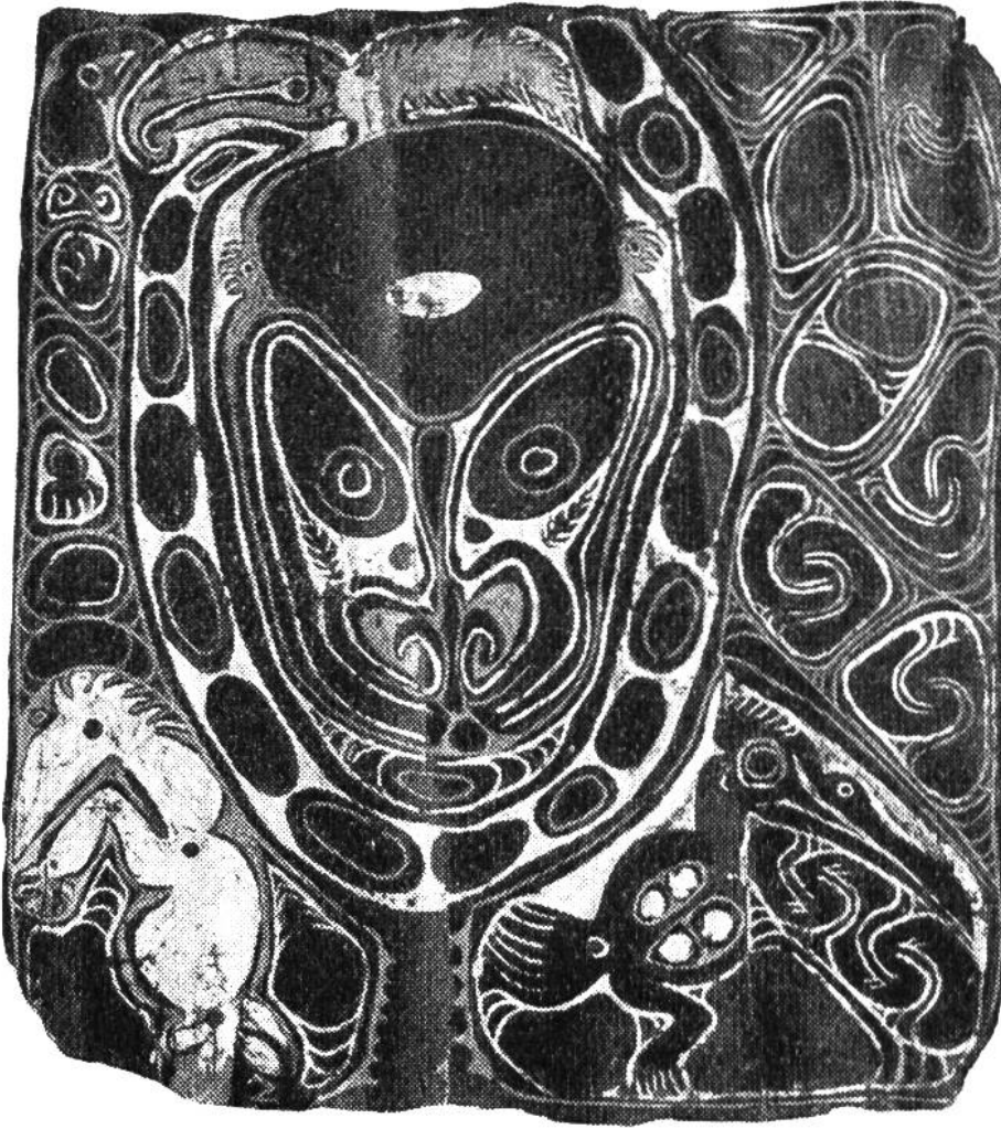
Malerei auf Blütenscheiden einer Palme. Aus dem mittleren Sepik-Gebiet auf Neuguinea. Sammlung F. Speiser.

schalen, einem geflochtenen Bart, Haaren aus Kasuarfedern, Ohrgehängen aus Schildpatt und einem Nasenschmuck aus Eberhauern. Figuren dieser Art stellen Verstorbene dar. Sie wurden früher an einem Nebenfluss des Sepik angefertigt und in den Häusern zur Erinnerung an die Toten und zur Verehrung derselben aufgestellt.