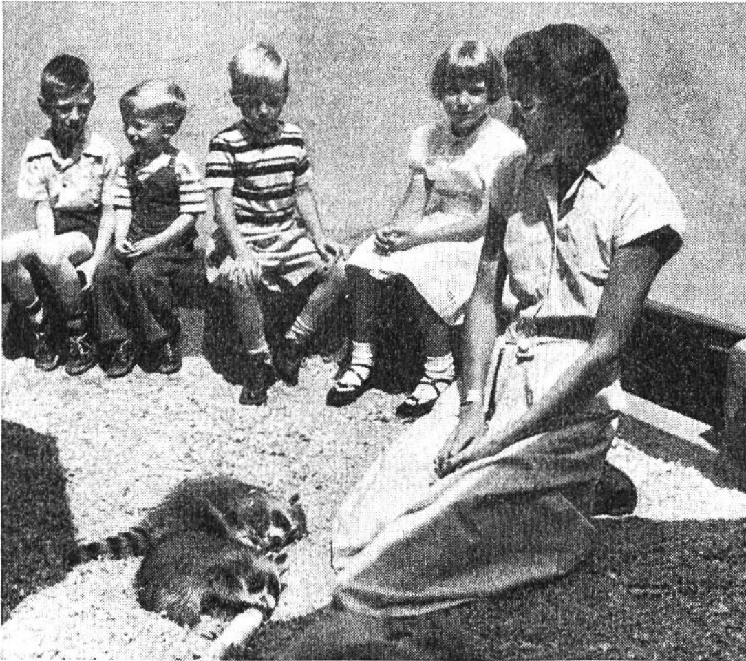
Die Zoo-Lehrerin von Detroit erzählt von Waschbären und zeigt, wie sie spielen.

durch, dass man ein Tier mit Gewalt heranholt und umschlingt, sondern nur dadurch, dass der Mensch das Tier liebevoll und respektvoll auffordert, zu ihm zu kommen. Dem Tier muss daher alle Freiheit gelassen werden; man darf es unter keinen Umständen zwingen – auch wenn man es noch so gerne Herzen und in die Arme schliessen möchte. Dem Tier ist das oft unheimlich, und es kann sich ja nicht wehren. Wehrhafte Tiere gibt es im Tierkindergarten nicht, weil sie die Menschenkinder verletzen könnten. – Der Kinder-Zoo in diesem Sinn ist also eine höchst zwiespältige, für das Tier sehr zweifelhafte Angelegenheit.