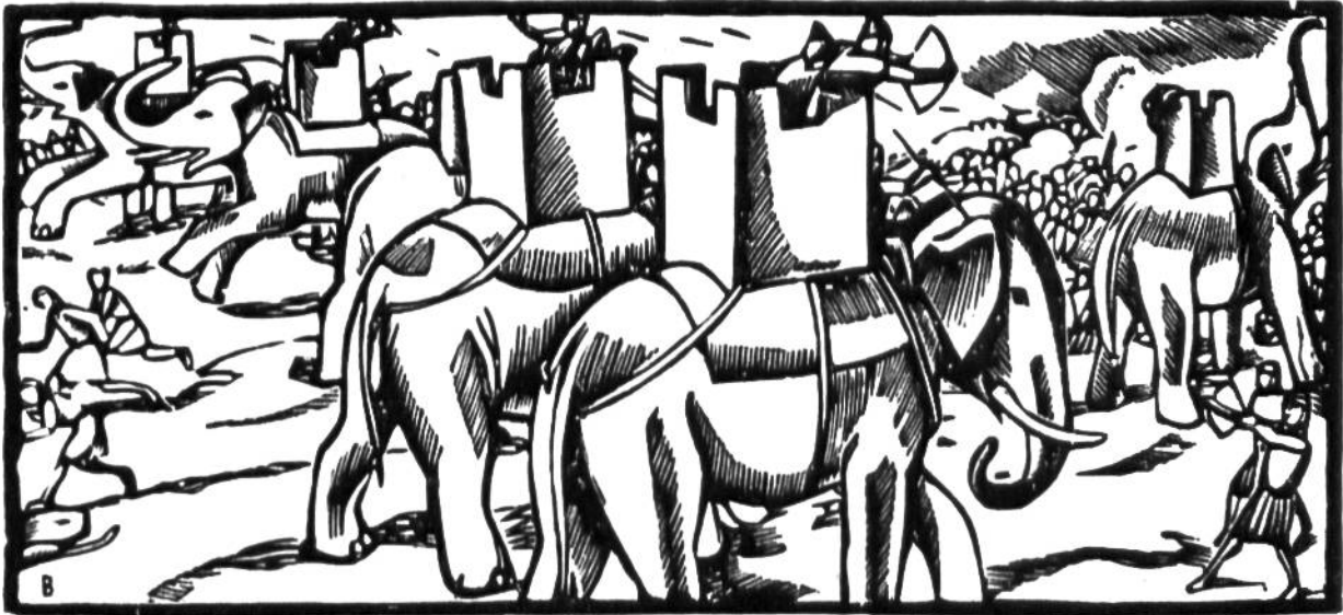
Die Elefanten Hannibals in der Schlacht bei Zama (202 v. Chr.). Entscheidungssieg von Rom über Karthago. Die römischen Legionen gerieten anfänglich durch das Heranstürmen der Elefanten in Verwirrung, besiegten dann aber doch das karthagische Heer.