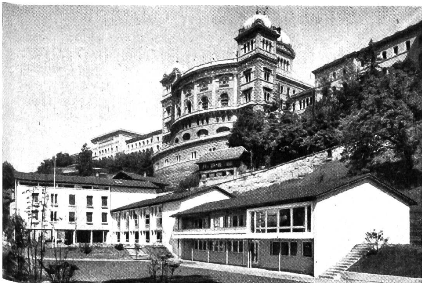
Bundeshaus und Jugendhaus in Bern: Zwei Bauten grundverschiedener Bau-epochen.