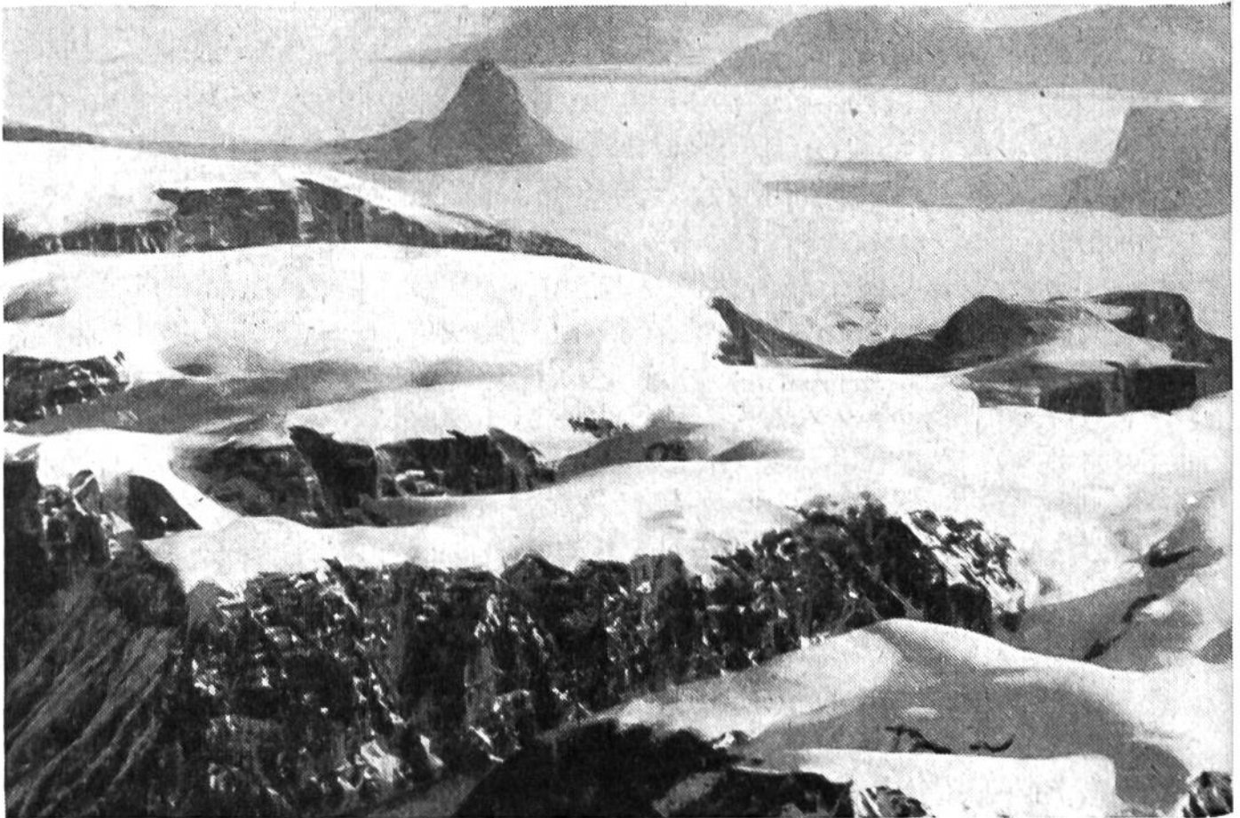
Blick auf das tafelförmige Küstengebirge in der Nähe des magnetischen Südpols.

Die Beschaffenheit des Landes können wir an eisfreien Küstestücken oder an den Gebirgszügen erkennen, die mit ihren Gipfeln über das 2000–3000 Meter dicke Inlandeis hinausragen und von denen der höchste in der Westantarktis bis 6000 Meter emporsteigt. Die Gebirgsketten der Westantarktis sind nichts anderes als die Fortsetzung der südamerikanischen Anden, während die Ostantarktis aus plateau-artigen Gebirgen aufgebaut ist.