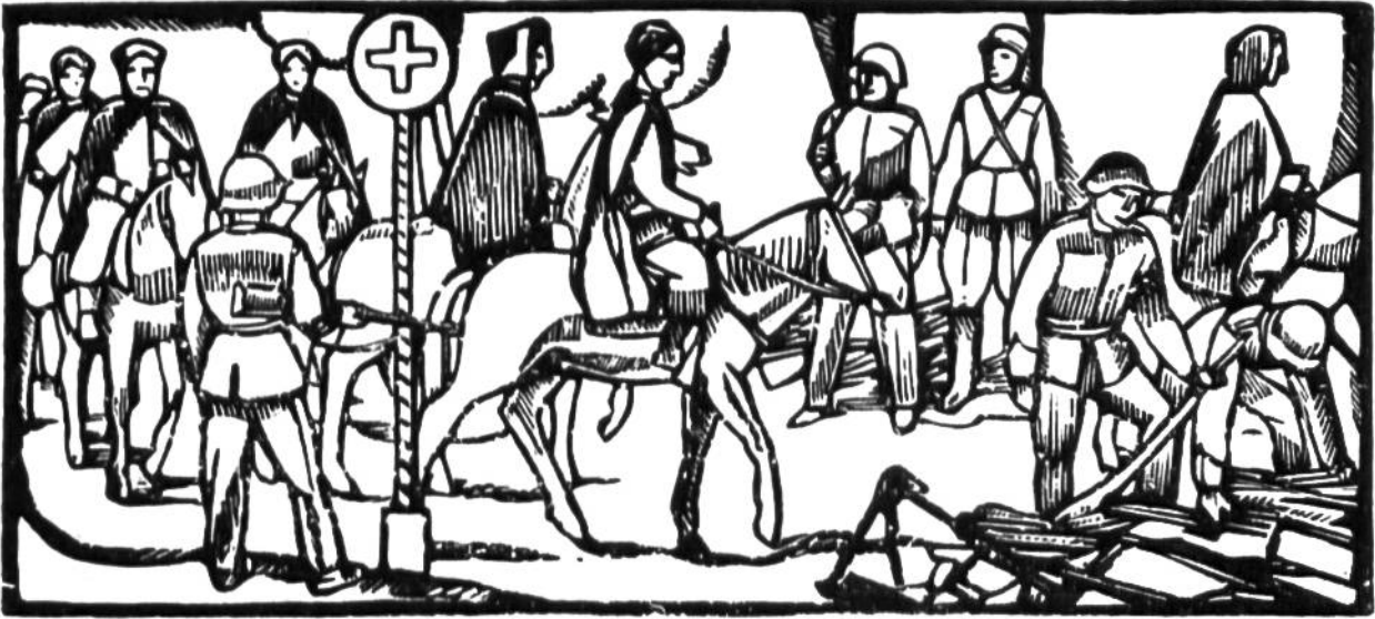
Im Juni 1940 überschreiten nahezu 40 000 alliierte Truppen die Schweizer Grenze. Waffenabgabe der Spahis im Berner Jura.