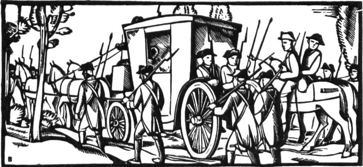
Ludwig XVI. wurde auf der Flucht in Varennes gefangengenommen und mit seiner Familie nach Paris zurückgeführt (1792).

1789–1793 Französische Revolution. 1789 Nationalversammlung, Mirabeau. 1791 bis 1792 Gesetzgebende Versammlung.