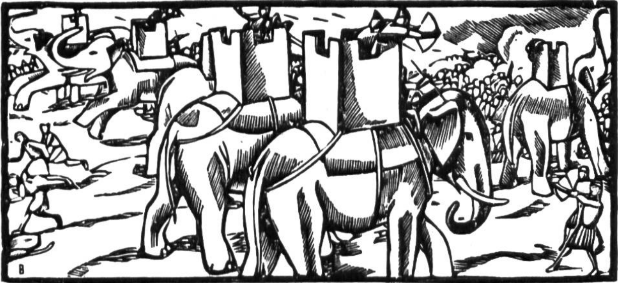
Die Elefanten Hannibals in der Schlacht bei Zama (202 v. Chr.). Entscheidungssieg von Rom über Karthago. Die römischen Legionen gerieten anfänglich durch das Heranstürmen der Elefanten in Verwirrung, besiegten dann aber doch das karthagische Heer.