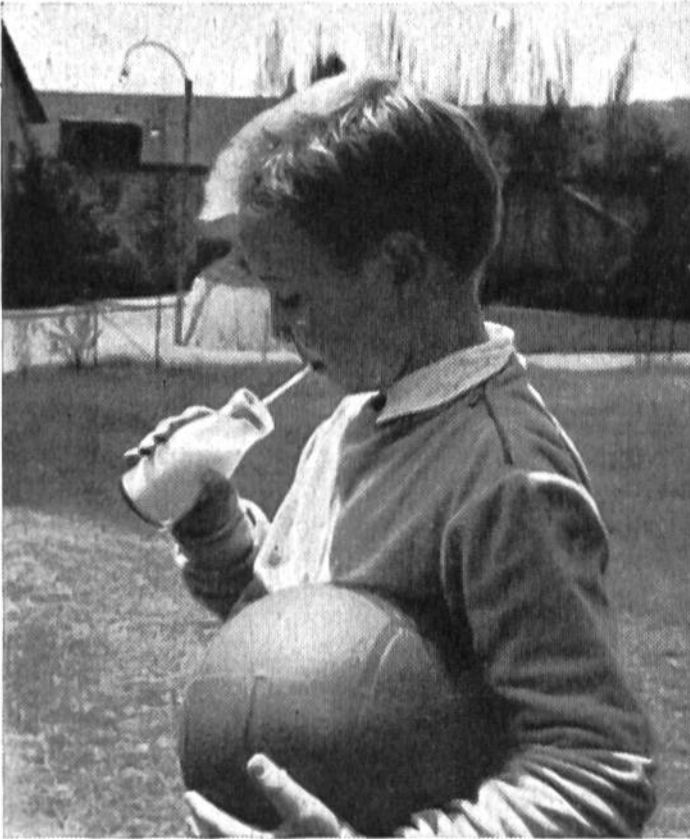
Wie herrlich schmeckt die kühle Schulmilch!

Sammelstelle, wohin die frische Milch jeden Morgen und Abend in der Tanse oder auf dem Milchkarren zu bestimmter Stunde gebracht wird, sorgt der Senn für exaktes Filtrieren und Kühlen dieses kostbaren Nahrungsmittels, das alsdann, soweit nicht für die eigene Kundschaft benötigt, in Vierzigliter-Kannen abgefüllt und per Auto oder Pferdefuhrwerk nach der nächsten Bahnstation rollt. Mit Hilfe kühner Seilbahnen oder besonderer Milchleitungen