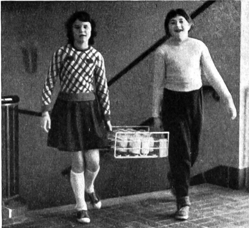
Begeistert holen Schülerinnen ihre Schulmilch ab.

chen ein Fläschchen pasteurisierter Milch erhalten. Diese regelmässig eingenommene Zwischenmahlzeit, die zu bescheidenem Preise, an bedürftige Schulkinder oft auch kostenlos, abgegeben wird, wirkt sich nach gemachten Beobachtungen ausser in einer besseren Gesundheit der Kinder auch in besseren Schulleistungen aus.