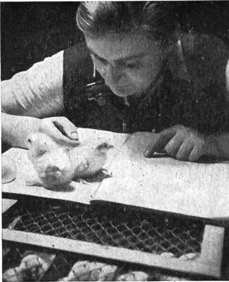
In den Hühnerfarmen der Dr. A. Wander AG. wird über die Jungtiere strenge Kontrolle geführt.

bei uns jetzt unbekannt. Für alle die kleinen Übel und Schmerzen kaufen wir uns in Gläschen und Tuben verpackte Heilmittel. Auf dem Gebiete der chemisch-pharmazeutischen Industrie bzw. der Diät-Nahrungsmittel hat die Firma Wander in Bern eine Pionierleistung vollbracht, wie wir alle von der bekannten Ovomaltine her wissen.