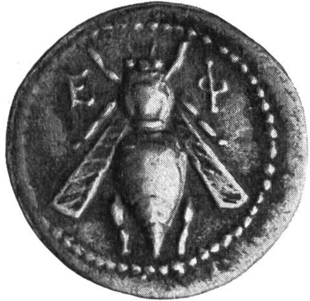
6. Silbermünze der Stadt Ephesus in Kleinasien, geprägt um 200 v. Chr. (Dm.: 17 mm).

heute noch nicht genau. Jedenfalls wurden sie auf einem Amboss mit schweren Hämmern von Hand geprägt, wobei man das Metallstück vorher stark erhitzte, um es geschmeidig zu machen. Das Münzbild selbst wurde mit primitiven Instrumenten spiegelverkehrt in ein hartes Stück Metall eingeritzt. Die wenigen Bilder aber zeigen uns, dass es sich bei den Herstellern der Münzen um ganz hervorragende Künstler handelte. Der Wert des Geldes war diesen gleichgültig. Wichtig war ihnen nur, künstlerisch erstklassige Arbeit zu leisten und mit den schönen Münzbildern Freude zu bereiten.