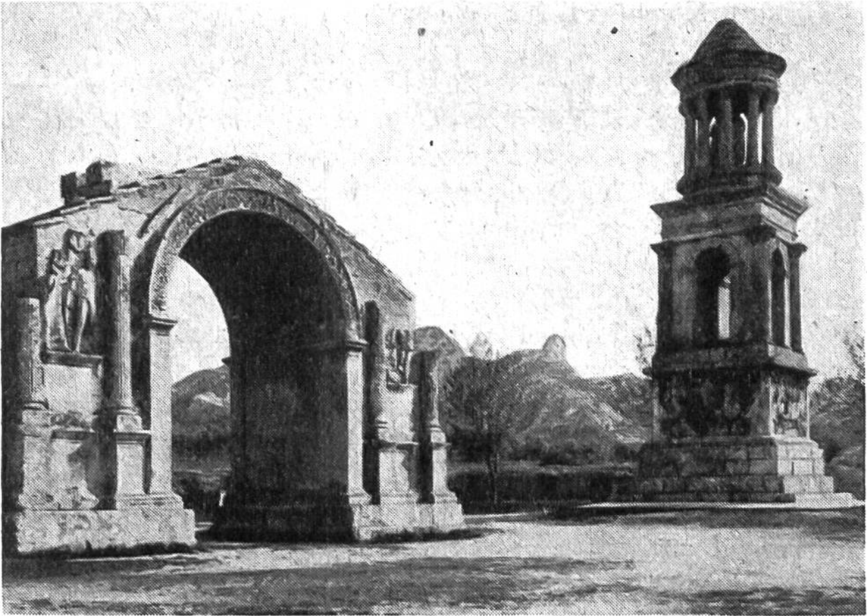
Triumphbogen und Grabmal der Julier bei St. Rémy in der Provence (Südfrankreich). Die alte Römerstadt wurde 480 n. Chr. von den Westgoten zerstört.

baute der Kaiser Hadrian das Pantheon, einen Rundbau, dem die Form einer Kugel zugrundeliegt, was bedeutet, dass die Raumhöhe der Raumweite entspricht. In diesem Tempel wurden alle Götter verehrt, die heimischen wie auch die fremden der unterworfenen Völker, um zu zeigen, dass Rom gewissermassen auch die Hauptstadt der Götter sei. So wurden Rom und im Gefolge der Eroberungen viele andere Städte des römischen Erdkreises mit Tempeln, Marktplätzen, Badehallen (Thermen), Triumphbögen, Grabdenkmälern und Ehrensäulen geschmückt, die noch heute von der Pracht und von der Macht des Römischen Reiches zeugen.