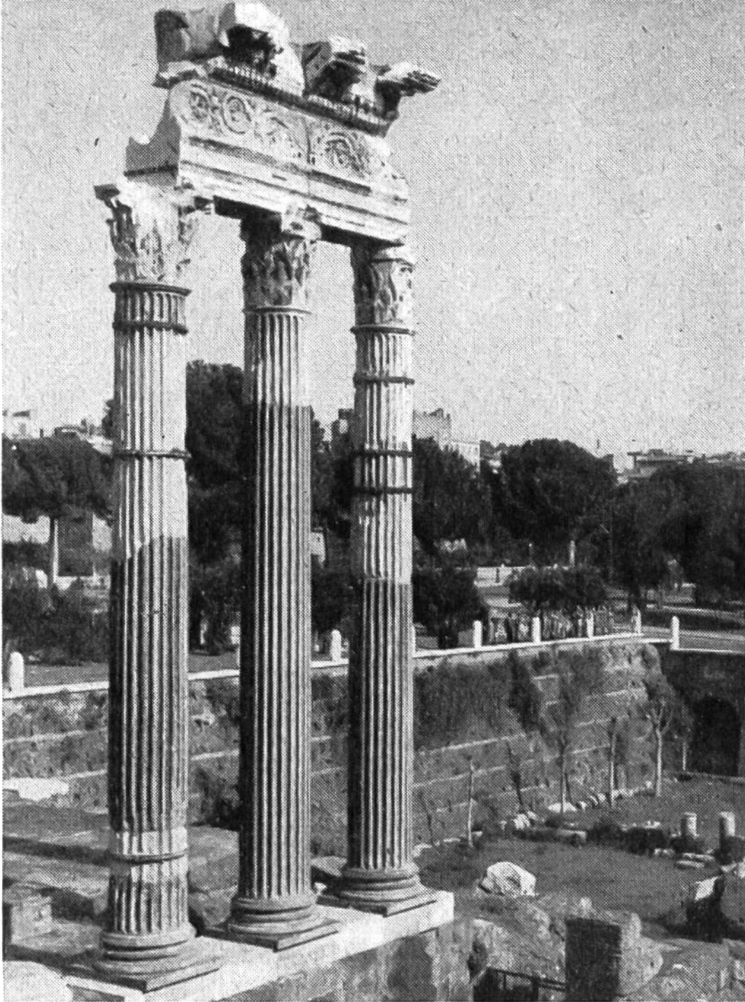
Rom. Auf dem Forum des Julius Caesar. Die prächtigen Säulen des Venustempels. Das höher gelegene Erdreich des Platzes wurde von zwei Jahrtausenden aufgetragen.

noch an die Etrusker erinnern. Zu den Tonnen- und Kreuzgewölben kamen die Kuppeln, und es entstanden um die Baukörper herum riesige Platz- und Gartenanlagen, die den Eindruck der gewaltigen Gebäude noch vergrößerten. Die Stadt Rom besonders erhielt unter den Kaisern ein glänzenderes Gewand. Eine Pracht in Bauten wurde entfaltet wie seitdem in keiner Stadt der Welt.