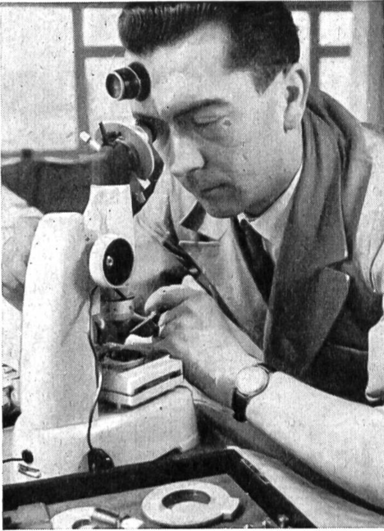
Einzelne Teile der Uhr müssen auf einen Tausendstel-Millimeter genau gearbeitet werden.

60 000 Arbeiter und Arbeiterinnen, deren Arbeitsstätten sich längs des Jura, von Genf bis nach Schaffhausen, hinziehen. Mit einer jährlichen Produktion von 30 Millionen Uhren gehört die Uhrmacherei zu den bedeutendsten Exportindustrien unseres Landes und trägt dazu bei, den guten Ruf der Schweiz als Herstellerin von Qualitätsprodukten im Ausland in Ehren zu halten.