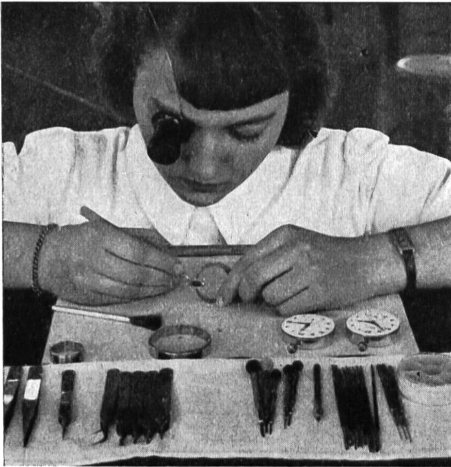
Die 120 Uhrenteile, welche das Uhrwerk bilden, werden oft von zarten Frauenhänden zusammengesetzt.

scher Produktion und billiger Reparaturen müssen Teile eines bestimmten Kalibers austauschbar sein. Dies erfordert eine äusserst gewissenhafte Ausführung gewisser Teile, deren Abweichung untereinander einen tausendstel Millimeter nicht überschreiten darf.