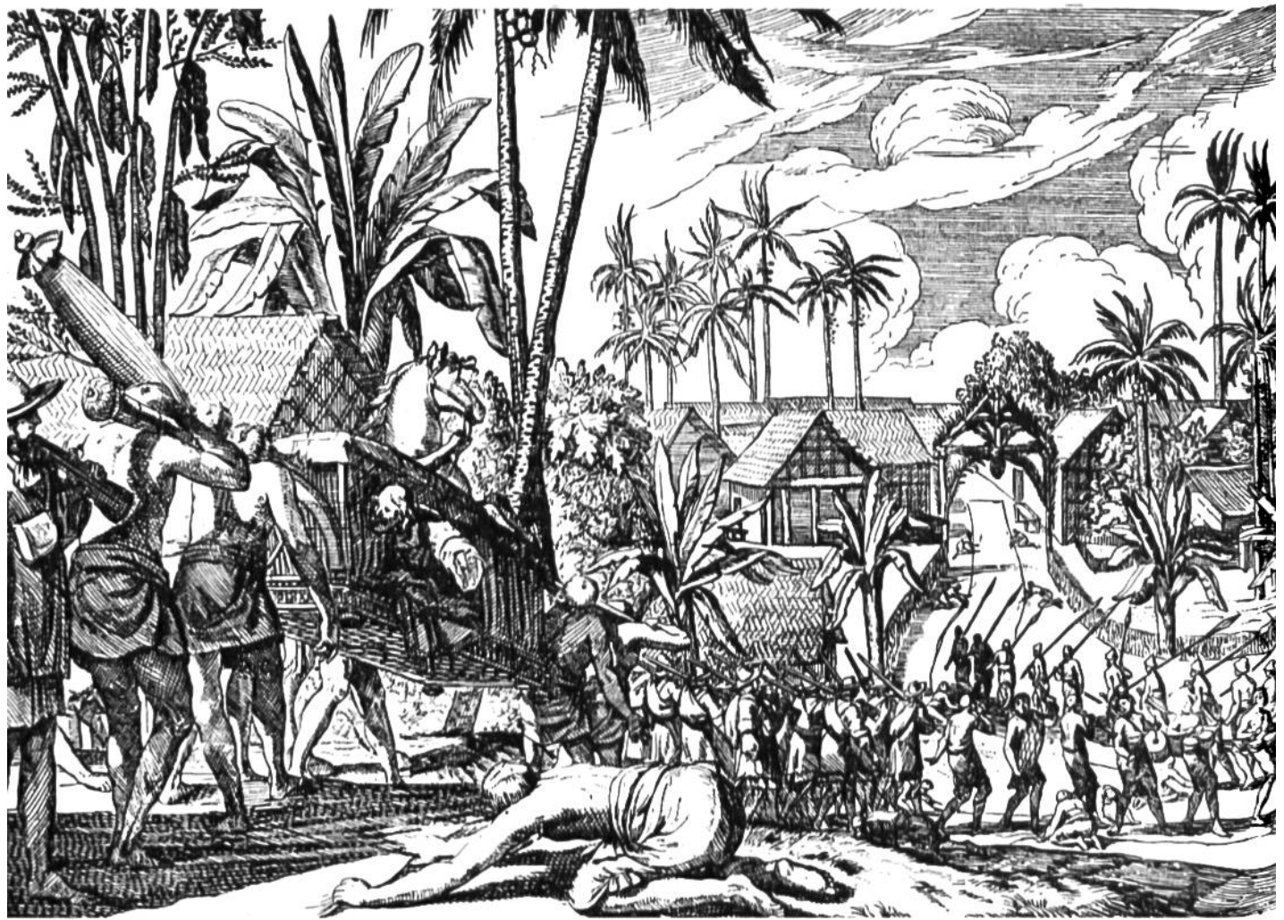
Einzug einer holländischen Truppe in Colombo auf Ceylon am 20. August 1665. Die Einwohner haben den Weg mit weissen Tüchern belegt.

Stadt Cochin, die von den Portugiesen besetzt gewesen war. Eingehend werden die Eingeborenen der Malabar-Küste beschrieben. Desgleichen berichtet Herport über die Insel Ceylon und ihre Bewohner, die er ebenfalls kennenlernte.