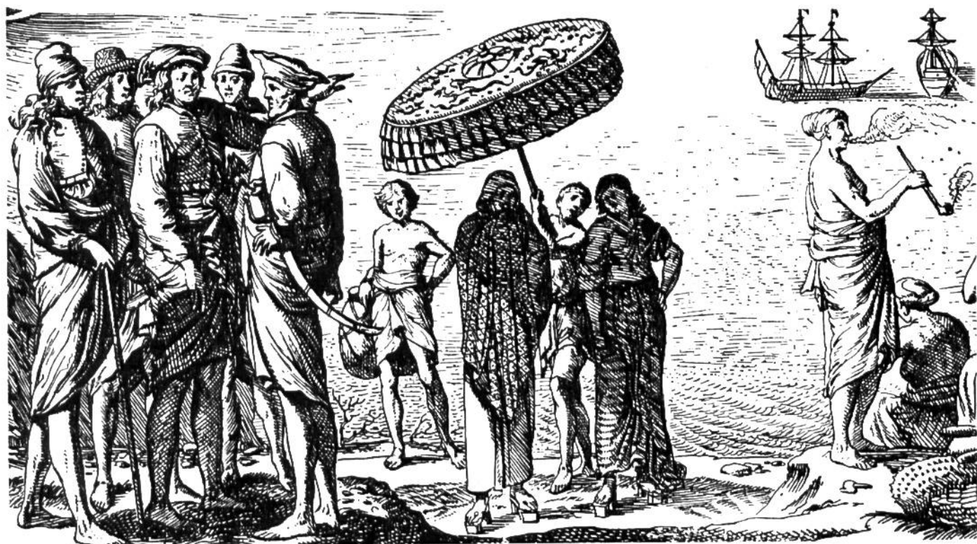
Eingeborene der Insel Ceylon.

Landschaften der von Herport besuchten Gebiete, ausserdem auch die Festungen zeigen, mit denen er in seiner Eigenschaft als Söldner in Berührung kam.