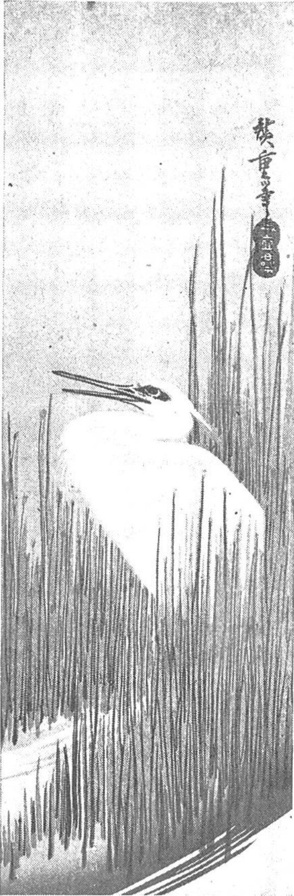
Reiher im Schilf.

schaften im Holzschnitt so volkstümlich auszudrücken, war etwas Neues; denn bis zirka 1825 hatte man hauptsächlich Menschen im