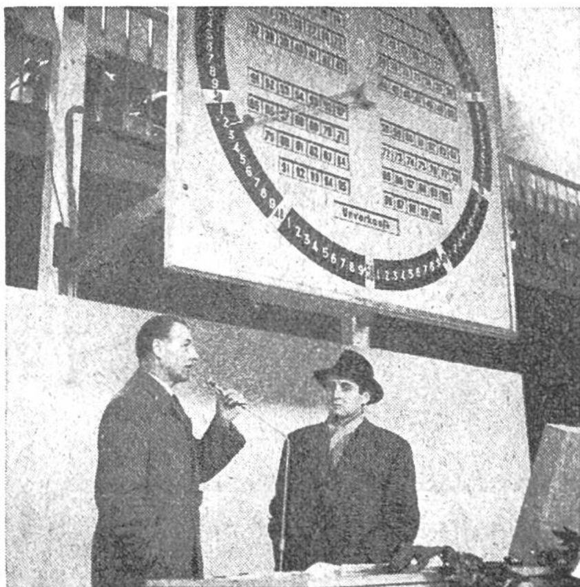
Die Versteigerungsur in Burgdorf zeigt aus- sen die Zahlen für die Preise, innen die Num- mern der Käufer.

In der Schweiz ist eine derartige Versteigerung für Obst und Gemüse «über die Uhr» zum erstenmal im Herbst 1956 in Burgdorf durchgeführt worden. Der Erfolg war so gut, dass die Einführung dieser Methode für 1957 beschlossen wurde. Für Blumen hat sich jedoch vorläufig ein anderes Verkaufssystem auf genossenschaftlicher Grundlage, die «Blumenbörse» in Zürich, als zweckmässiger erwiesen.