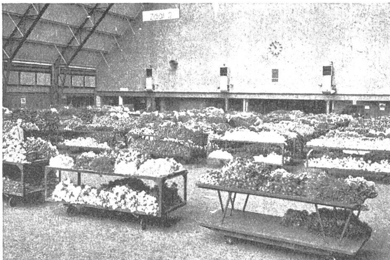
In einer der fünf grossen Hallen von Aalsmeer (Holland) sind die Schnittblumen auf fahrbaren Tischen zur Besichtigung aufgestellt.

sich gegenüber der Tribüne befindet, setzt sich in Bewegung, indem er erst einen überdurchschnittlich hohen Preis anzeigt und dann absinkt. Sobald ein Käufer die Ware zu dem gerade angezeigten Preis kaufen möchte, drückt er auf den Knopf an seinem Platz, die Uhr bleibt stehen und die Nummer des Käufers leuchtet auf. Die Uhr reagiert auf einen Unterschied von nur \frac{1}{20} Sekunde, so dass die Gefahr praktisch ausgeschaltet ist, dass zwei Käufer zur genau gleichen Zeit auf den Knopf drücken. Würde der Käufer noch länger zuwarten, so könnte er die Ware billiger erhalten, riskiert jedoch, dass ihm ein anderer Käufer zuvorkommt und er infolgedessen leer ausgeht. Die Ware muss meistens bar bezahlt und sofort mitgenommen oder weggeschickt werden.