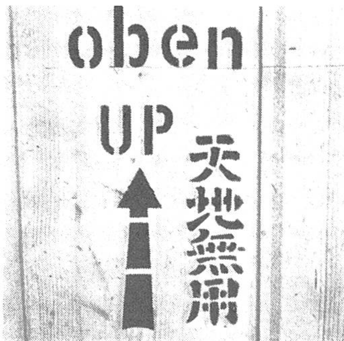
Die japanische Inschrift für «nicht kippen» ist mittels einer Schablone auf der Kiste angebracht worden.

Ähnlich wie die Schweiz ist Japan gezwungen, Lebensmittel einzuführen; und dies ist aus wirtschaftlichen Gründen nur bei entsprechender Ausfuhr industrieller Produkte möglich. Die verschiedensten Dinge – von der Seife bis zu Eisenbahnlokomotiven mit den dazugehörigen Schienen –, die früher vom Ausland ge-