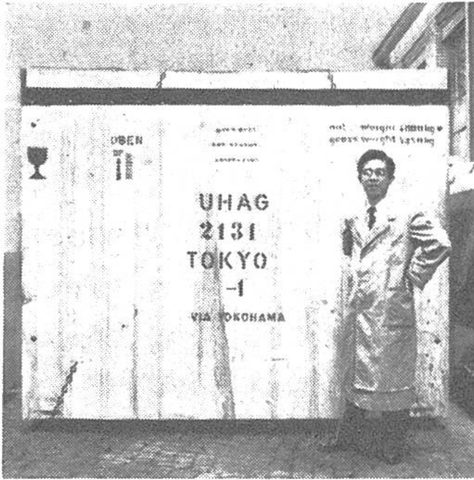
Der japanische Abnahmeingenieur der Übersee-Handel A.G. überwacht den Abtransport einer seemässig verpackten Zahnradschleifmaschine von Reishauer, Zürich.

europäischer Länder zum Opfer fallen könnten. Seitdem hat Japan in etwa 100 Jahren einen beispiellosen Aufschwung erlebt und steht seit Jahrzehnten als das Industrieland Nummer eins in Asien da. Japan hat mit Fleiss und trotz abwegigen kriegerischen Unternehmungen einen gewaltigen Vorsprung gegenüber allen andern Staaten Asiens gewonnen. Auch heute ist das Land bemüht, seine Industrie weiter auszubauen und zu verbessern.