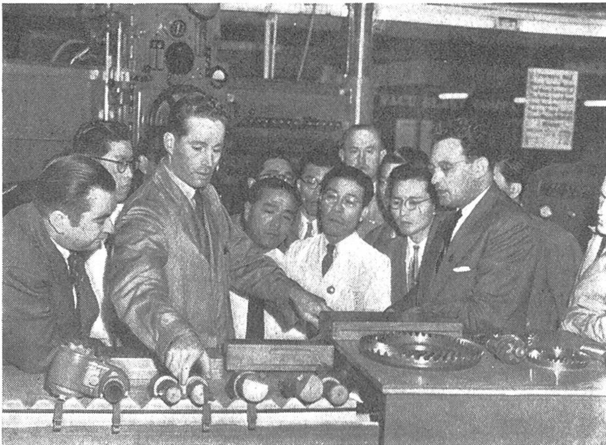
Schweizer Ingenieur in Tokio beim Erklären der Anwendung einer Verzahnungsmaschine der Werkzeugmaschinenfabrik Bührle, Oerlikon; rechts vorn: der Übersetzer.

an der unter anderem die neuesten Schweizer Maschinen von Fachleuten vorgeführt werden. Diese Messe besitzt, verglichen mit unsern Messen, eine besondere Note, die durch die eigenartige Kultur Japans bedingt ist. So sehen wir zum Beispiel als Wimpel schwarze und rote Riesenkarpfen mit vom Wind aufgeblähten Leibern an Fahnenstangen wehen. Junge Damen in prächtigen Kimonos und mit Blumenkörbchen wandeln gleichsam als Mannequins durch die breiten Strassen zwischen den Hallen.