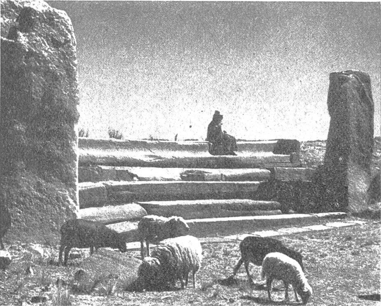
Steinerne Freitreppe aus der Vorinkazeit am Sonnentempel von Tihuanacu.

ter arbeiten, um in dem geheimnisreichen Buch ältester Vergangenheit zu lesen. – Wir zeigen auf unseren Bildern Reste des Sonnentempels Kalasasaya bei dem bolivianischen Dorf Tihuanacu. Einzelne Steine (Monolithe) der über 60 m langen Erkerwand des Sonnentempels wiegen mehr als 7000 kg. Wir wissen auch, dass der Steinbruch, aus dem man die Quadern mit Feuer aussprengte, 40 km vom Bauplatz entfernt liegt. Welch gewaltige menschliche Leistung spricht aus diesen Zahlen! Die grosse Freitreppe, vor der heute Schafe weiden, führte von der Ostseite zum Tempel hinan. Vielseitige Messungen der Forscher vereinigen ihre Zahlen zu einer Altersdatierung des Baues und errechnen ein Alter von ungefähr 17000 Jahren.