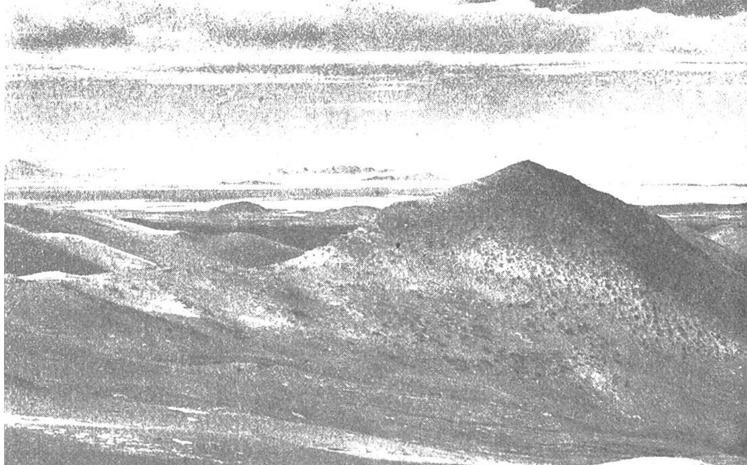
Blick über das bolivianische Hochland.