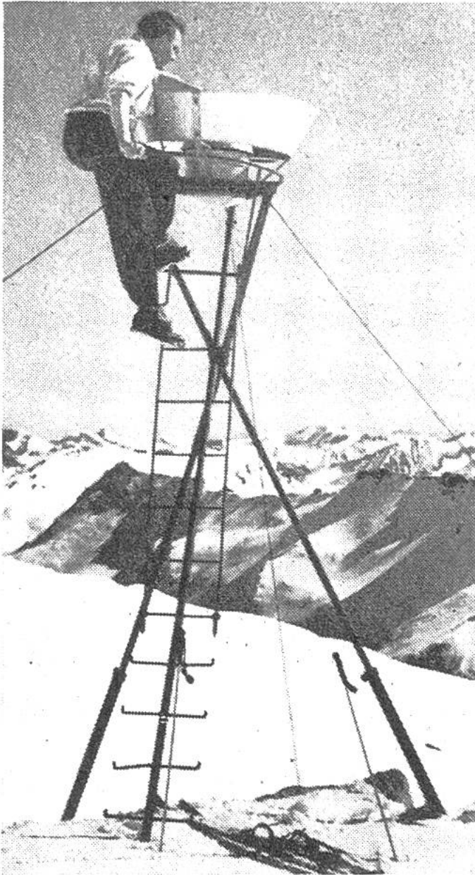
Der Regenmesser wird kontrolliert und geleert, um die Schmelzwassermenge des gefallenen Neuschnees zu bestimmen.

Fällen sogar ein einziger Eisklumpen, der vor der Messung erst mühsam weggepickelt werden muss. Photographiert wurde natürlich erst nach dem Aufklaren, als sich das Schlechtwettergebiet verzogen hatte. Dann ist es nicht schlimm, auf der Leiter zu stehen – doch wenn der Wind mit 100 Stundenkilometer feine Eisnadeln ins Gesicht bläst, ist das Säubern eine schwierige Aufgabe. Auch das Leeren des Niederschlagsmessers, der zur Erzielung einer richtigen Messung mit einem trichterförmigen Schutzmantel versehen ist, bietet dann grosse Schwierigkeiten. Der Barograph, der den Luftdruckverlauf getreulich aufzeichnet, versieht glücklicherweise seinen Dienst im trauli-