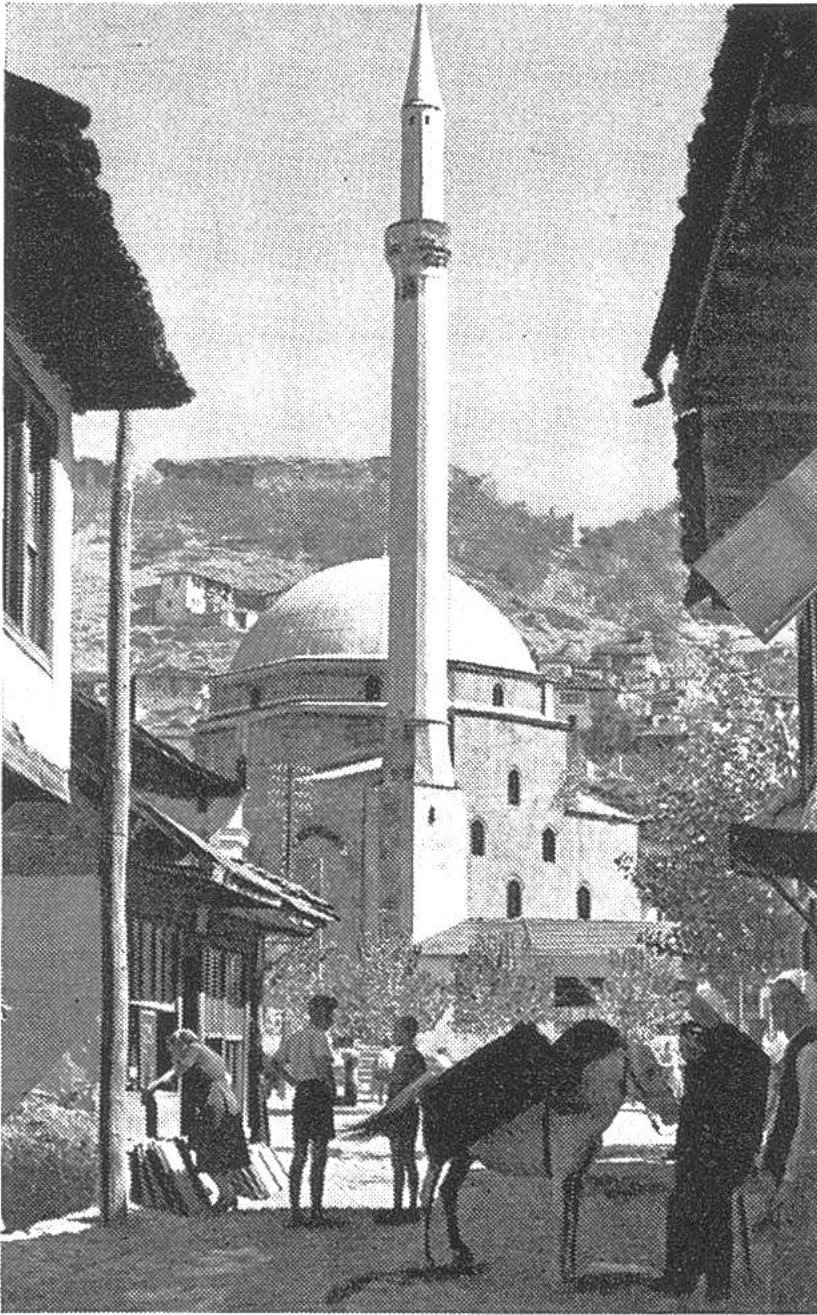
Nach der jahrhundertelangen Türkenherrschaft auf dem Balkan haben sich zahlreiche muslimische Gemeinden – wie hier in Prizren – inmitten christlicher Länder zu halten vermocht.

tägliche Gebet und den Unterricht geöffnet sind. Angegliedert finden sich meist Bibliotheken, Räume für Armen- und Krankenpflege wie auch gelegentlich Mausoleen, das sind Grabstätten bedeutender Geistlicher oder Herrscher. Der eigentliche «Versammlungsort» jedoch sieht in der Regel folgendermassen aus: Ursprünglich bestand er bloss aus einem umfriedeten Raum unter freiem Himmel; allmählich wurde dieser «Betplatz» nur noch als Hof benutzt, der von Bogengängen umsäumt ist und einen Brunnen besitzt, an welchem vor Beginn des Gottesdienstes die rituellen Waschungen von Gesicht, Mundhöhle, Händen und Füßen vorgenommen werden. Das Minarett steht als schlanker,