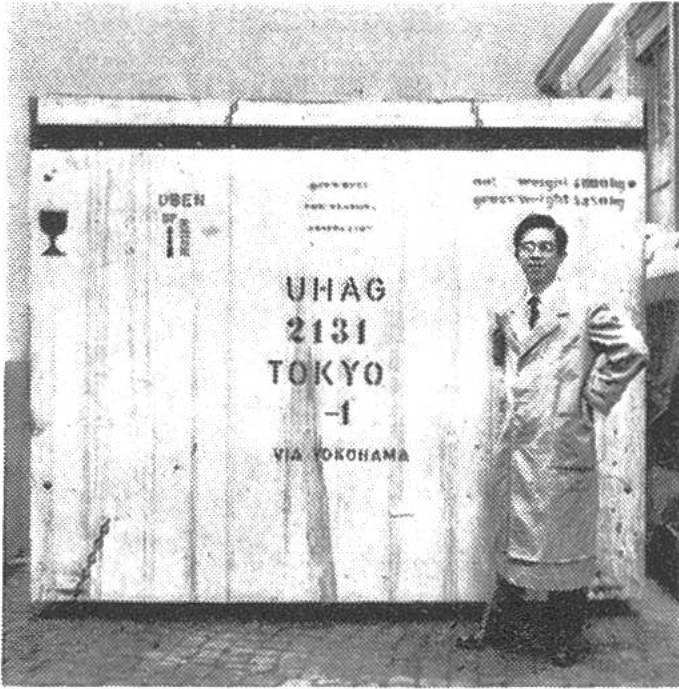
Der japanische Abnahmeingenieur der Übersee-Handel A.G. überwacht den Abtransport einer seemässig verpackten Zahnradschleifmaschine von Reishauer, Zürich.

europäischer Länder zum Opfer fallen könnten. Seitdem hat Japan in etwa 100 Jahren einen beispiellosen Aufschwung erlebt und steht seit Jahrzehnten als das Industrieland Nummer eins in Asien da. Japan hat mit Fleiss und trotz abwegigen kriegerischen Unternehmungen einen gewaltigen Vorsprung gegenüber allen andern Staaten Asiens gewonnen. Auch heute ist das Land bemüht, seine Industrie weiter auszubauen und zu verbessern.