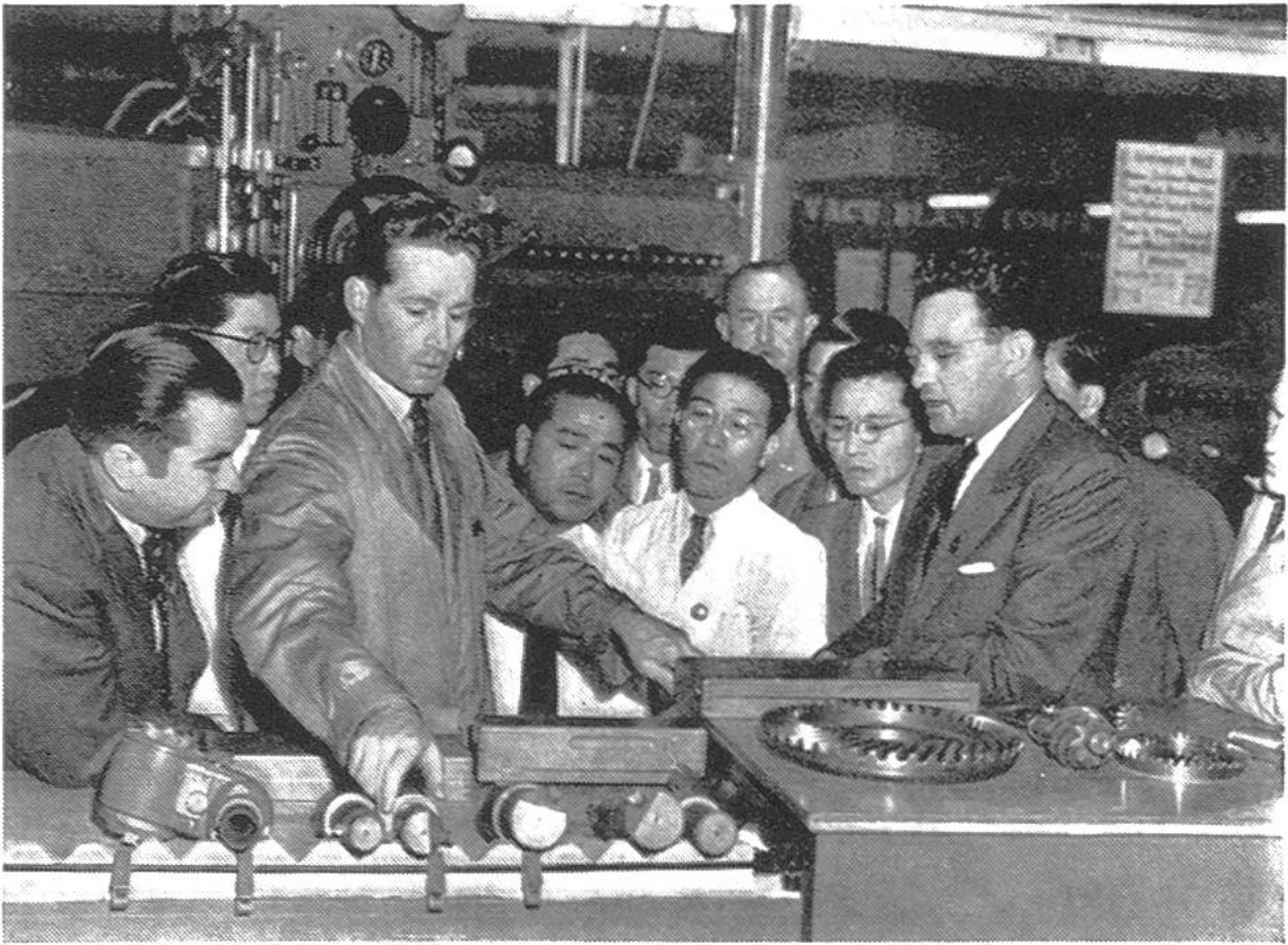
Schweizer Ingenieur in Tokio beim Erklären der Anwendung einer Verzahnungsmaschine der Werkzeugmaschinenfabrik Bührle, Oerlikon; rechts vorn: der Übersetzer.

an der unter anderem die neuesten Schweizer Maschinen von Fachleuten vorgeführt werden. Diese Messe besitzt, verglichen mit unsern Messen, eine besondere Note, die durch die eigenartige Kultur Japans bedingt ist. So sehen wir zum Beispiel als Wimpel schwarze und rote Riesenkarpfen mit vom Wind aufgeblähten Leibern an Fahnenstangen wehen. Junge Damen in prächtigen Kimonos und mit Blumenkörbchen wandeln gleichsam als Mannequins durch die breiten Strassen zwischen den Hallen.