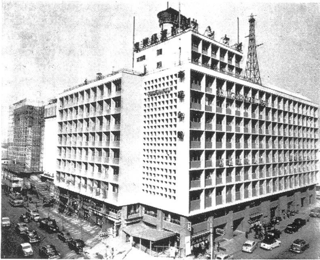
Das Sankei-Gebäude, eines der vielen modernen Geschäftshäuser von Tokio, in welchem die Zweigstelle der Übersee-Handel A.G. untergebracht ist.