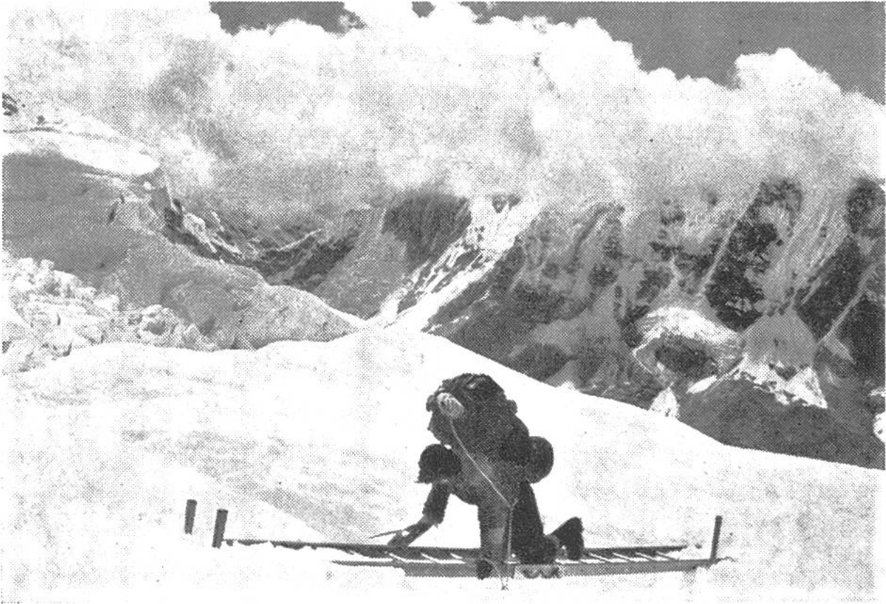
Aluminium-Leiter zum Überqueren einer Gletscherspalte (Khumbu-Eisbruch). Schweizer Mt.-Everest-Expedition 1956.

Die Qualität des Schweizer Aluminiums und seiner Legierungen sowie die Präzision seiner Halbfabrikate sind auch im Ausland bekannt, so dass die Produktion gut exportiert werden kann. – Der beispiellose Erfolg des Aluminiums beruht zum Teil auf seinen besonderen Materialeigenschaften. Dank seinem geringen spezifischen Gewicht von nur 2,7 wurde es der ideale Baustoff für Flugzeuge, Autos und Schnellboote. Auch die letzte schweizerische Mount-Everest-Expedition wusste sich diesen Vorteil zunutze zu machen. Seilwinden, Kochgerät, Kannen, Sauerstoffapparate und vieles mehr aus Aluminium ersparte manche Transportkiste. Dass Aluminiumlegierungen trotz ihrem leichten Gewicht auch sehr fest sein können, beweisen Brücken, Baugerüste, Lawinverbauungen oder z.B. die Al-Pufferhülsen der SBB. Für einen Konstrukteur liegt das Verlockende darin, dass sich Aluminium fast zu jeder beliebigen Form verarbeiten lässt. Chippiser Profile gelangen in allen Variationen, vom Uhrengehäuse bis zum Balken für Schiffgerippe, in die Welt hinaus. Zu dünner Folie ausge-