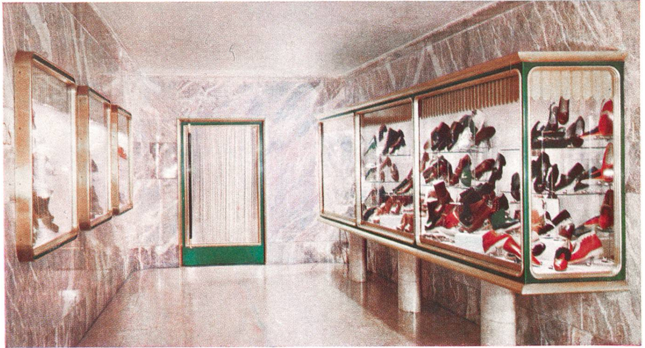
Farbig anodisierte Aluminium-Profile ergeben ein freundliches Schaufenster. (Siehe auch Seite 233.)