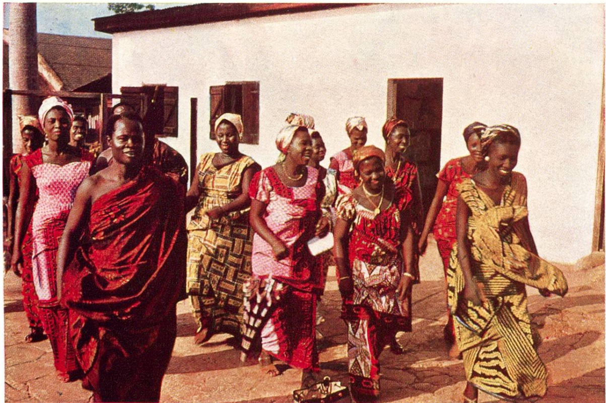
Eingeborene aus Kumasi, dem Hauptort von Ashanti (Ghana), in farbenfrohen Gewändern, die durch die Textildruckerei Hohlenstein AG. in Ennenda (Glarus) bedruckt worden sind. (Siehe auch Seite 246.)