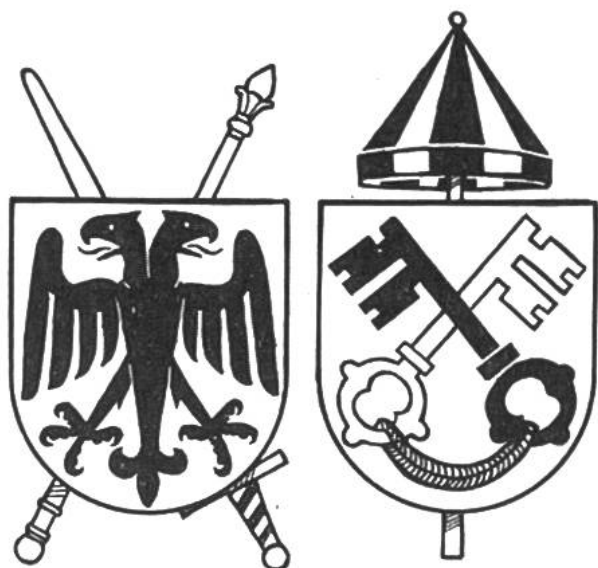
Die Wappen von Kaiser und Papst

375–444 Die Hunnen beginnen ihre Wanderung u. dringen in Europa bis an die Donau vor.