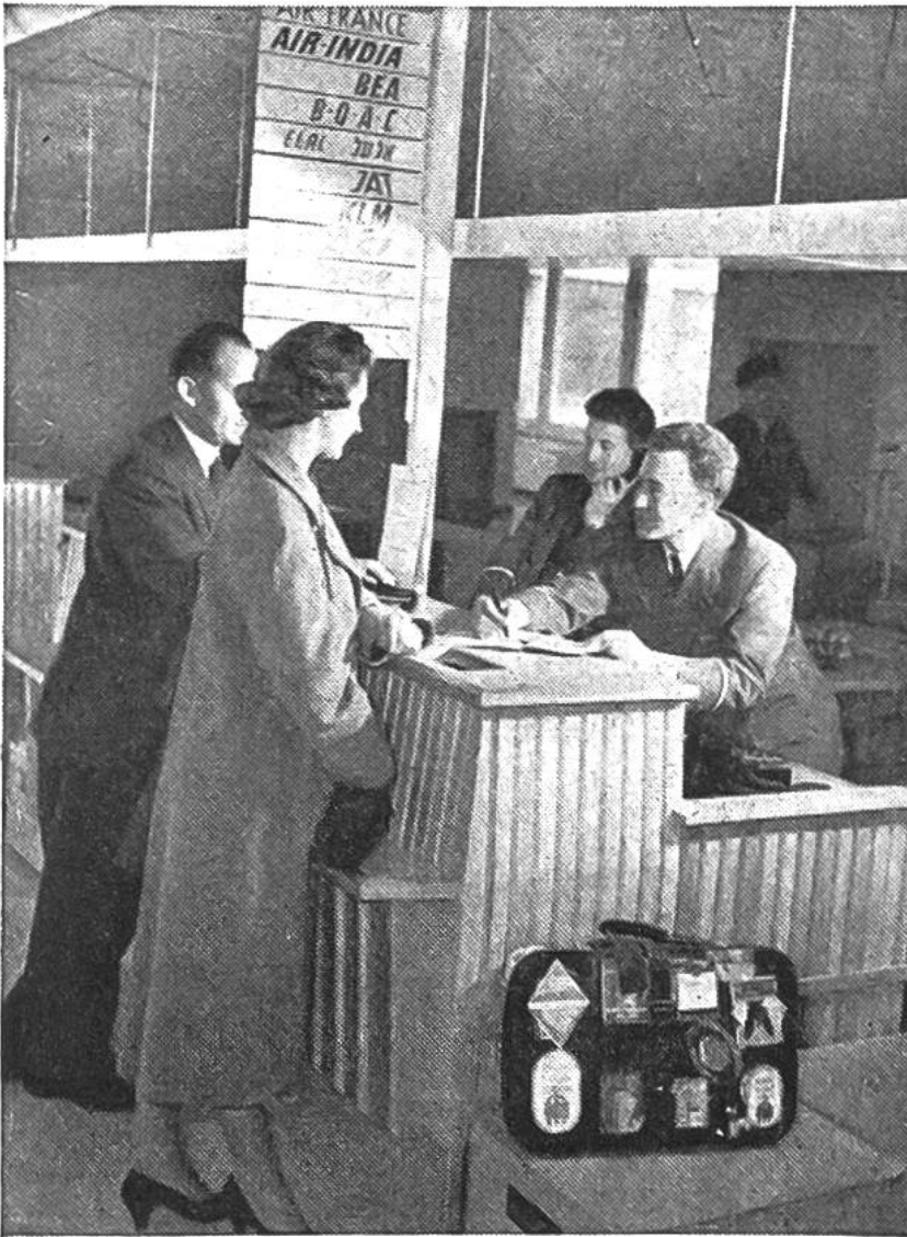
Kontrollieren der Flugscheine am Schalter vor dem Abflug und Abfertigung des Gepäcks.