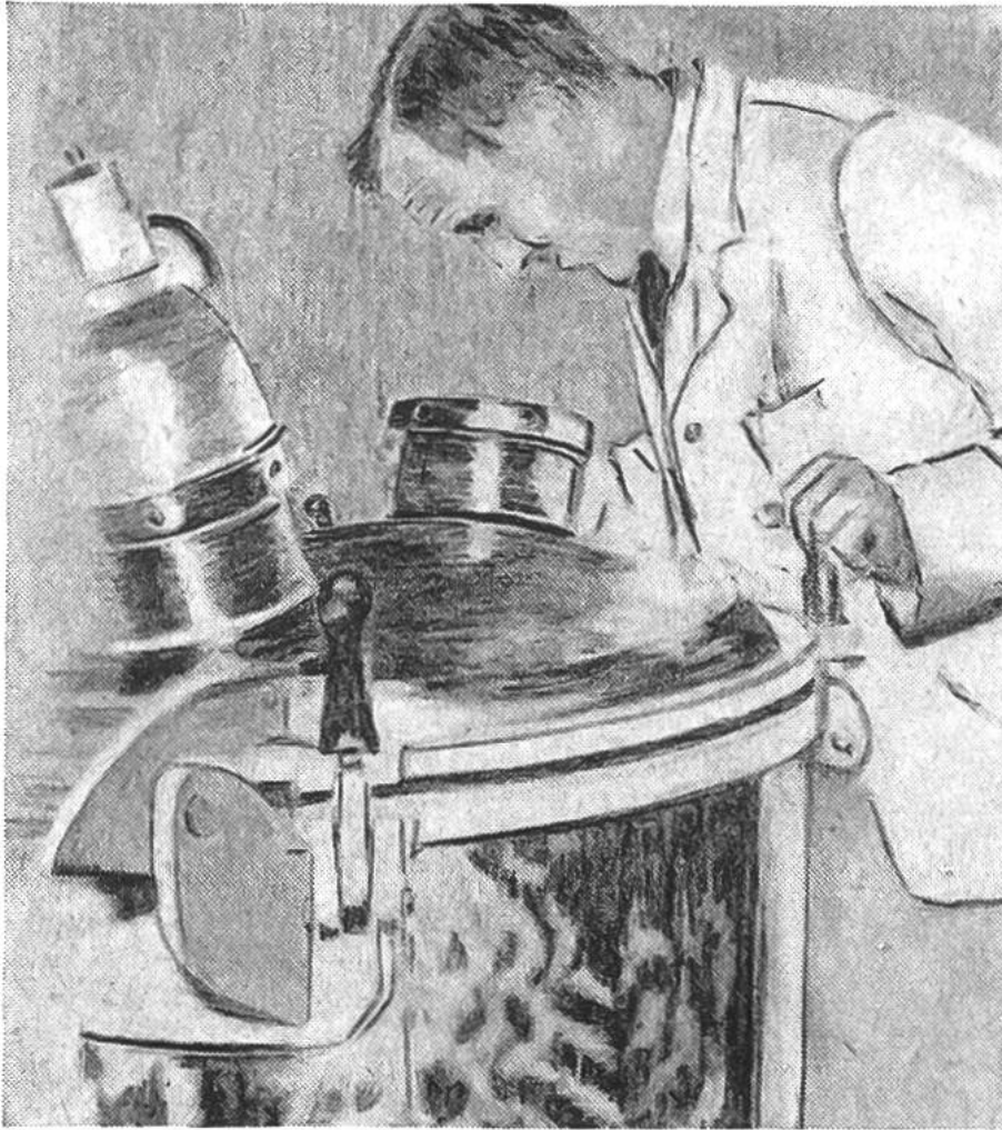
Überwachung des Uperisationsvorganges am Expansionsgefäß.

des 19. Jahrhunderts fällt, hat dann weitgehend das Verständnis für das Verhalten der Milch unter verschiedenen Aufbewahrungsbedingungen gefördert. Es wurde klar, dass alle unerwünschten Veränderungen der Milch auf der Tätigkeit verschiedener Arten von Mikroorganismen (kleinsten Lebewesen) beruhen. Der französische Forscher Louis Pasteur hat in den sechziger Jahren des letzten Jahrhunderts entdeckt, dass Bier und Wein durch Erhitzung auf Wärmegrade unterhalb 100^{\circ}\text{C} während einer gewissen Zeit vor dem Verderben geschützt werden können. Versuche mit Milch zeigten, dass vor allem die pathogenen, d. h. krankheitserregenden Keime abgetötet wurden, eine Erhöhung der Haltbarkeit jedoch nicht zu erreichen war. Dieses Erhitzungsverfahren, später als Pasteurisierung bezeichnet, hat im besondern in seiner Anwendung auf Milch eine weltweite Ausdehnung angenommen. Mit der Entwicklung der Hygiene erstrebte man eine von krankmachenden Bakterien möglichst freie Milch, ein Ziel, welchem