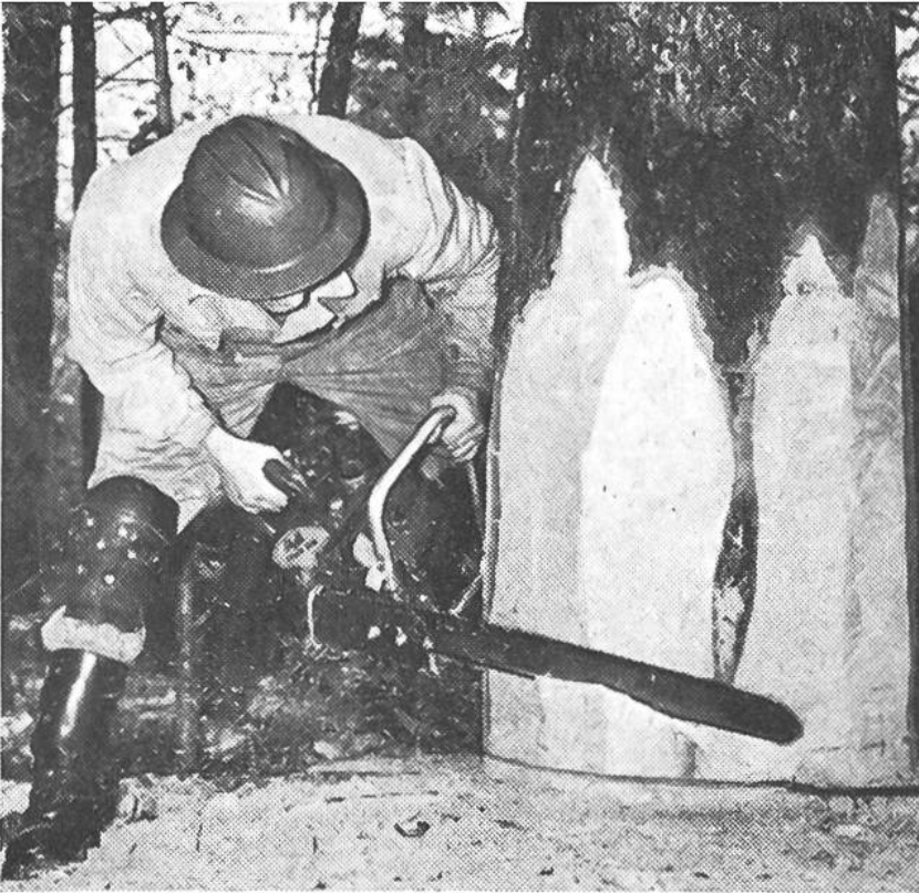
Die neuzeitliche Motorsäge verrichtet rasche Arbeit.

Auf vielen sonntäglichen Waldgängen ist dem Bauern fast jeder Baum seines Reviers vertraut geworden. Auf Grund seiner eigenen Beobachtungen, die er vielleicht noch mit einem geschulten