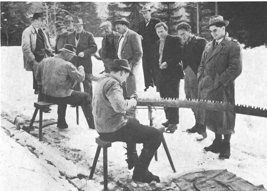
Feilen von Hobelzahnsägen an einem Werkzeugkurs für Waldarbeiter.

Auf vielen sonntäglichen Waldgängen ist dem Bauern fast jeder Baum seines Reviers vertraut geworden. Auf Grund seiner eigenen Beobachtungen, die er vielleicht noch mit einem geschulten