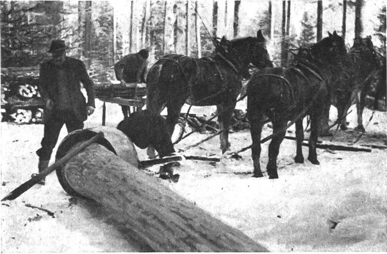
Holzschleifen mit einer Schlepphaube, die das Beschädigen der Wurzelstöcke stehengebliebener Bäume durch den Stamm verhindert.

Brandfall das Bauernhaus oder eine Scheune neu gebaut werden muss oder wenn der durch Seuchen dezimierte Viehbestand erneuert werden sollte. Nur in solchen Fällen wagt sich der sonst sparsame Bauer an das seit vielen Jahren geschonte, wertvolle Starkholz, das ihm nun willkommene Balken und Bretter für den Neubau oder vom Holzhändler das für den Viehkauf nötige Bargeld liefert. A. B.