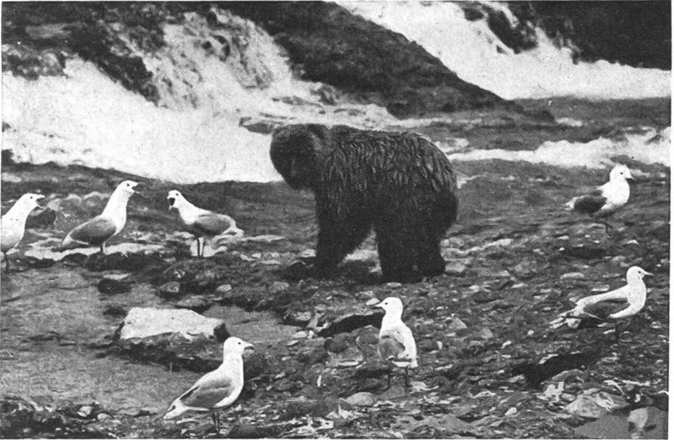
Hungrige Möwen warten in unmittelbarer Umgebung der braunpelzigen Fischer auf Abfälle.

Vor kurzem hat ein Beamter im Auftrage des amerikanischen Fischerei- und Jagddienstes die fischenden Bären von Alaska in ihrer Tätigkeit genau beobachtet. Jeder Bär hat am Fluss oder im Fluss seinen bestimmten Standplatz, den er so lange einnimmt, bis er sich mit den wohlschmeckenden Fischen vollgefressen hat; dann macht er einem seiner Artgenossen Platz, der geduldig gewartet hat. So kommen schliesslich eine ganze Anzahl Petze der Reihe nach zum Fischen und zum Festbraten.