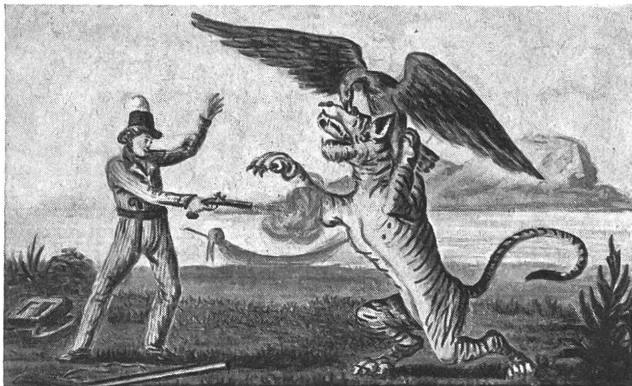
Kampf mit dem Tiger.

Das Buch wurde mehrfach übersetzt und in unzähligen Ausgaben in der Schweiz, Deutschland, Frankreich, Belgien, England, Amerika, Italien, Rumänien, Polen, Schweden und Holland gedruckt und fand bis heute bei vielen Kindern grossen Gefallen.