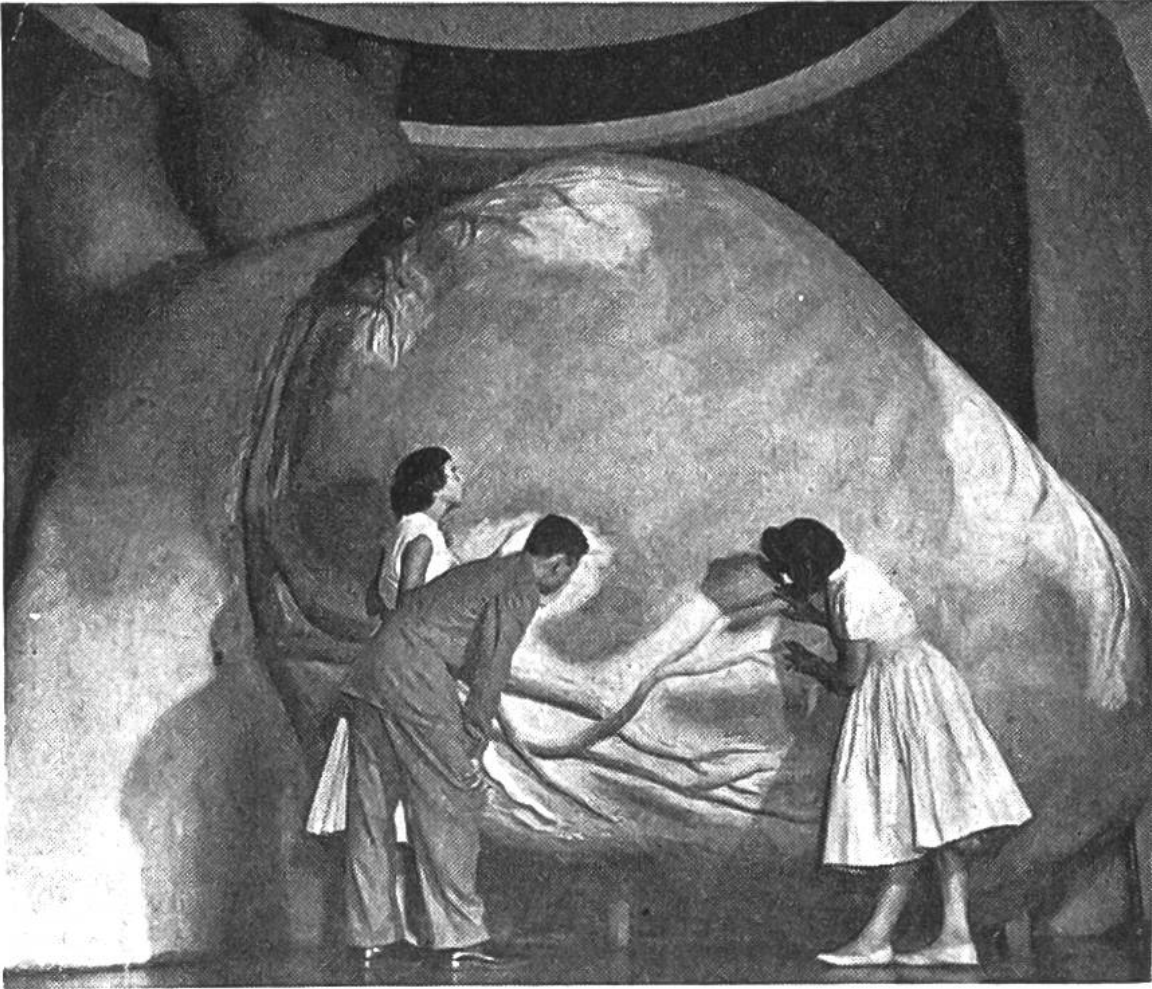
Das Herzmodell im Franklin-Institut, Philadelphia. Grosse Blutgefässe müssen den Herzmuskel, der unermüdlich arbeitet, mit Blut und damit mit den nötigen Nährstoffen versehen; denn auch er muss seine Kraft irgendwoher bekommen.