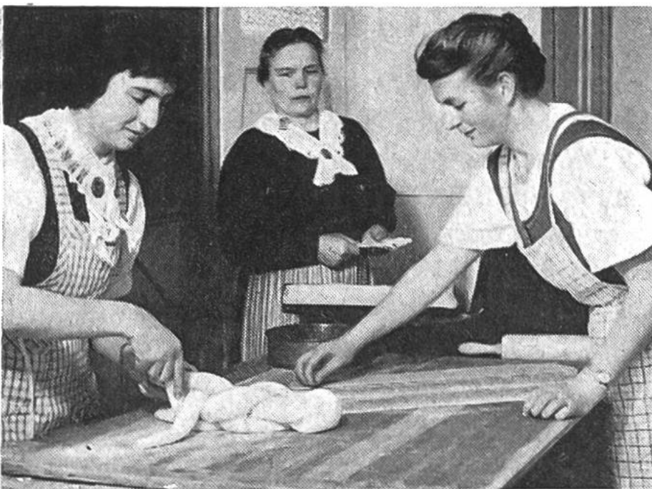
Unter den Augen der gestrengen Expertin wird der Eierzopf kunstgerecht geflochten.

Den Abschluss der beruflichen Ausbildung der Bäuerin stellt die