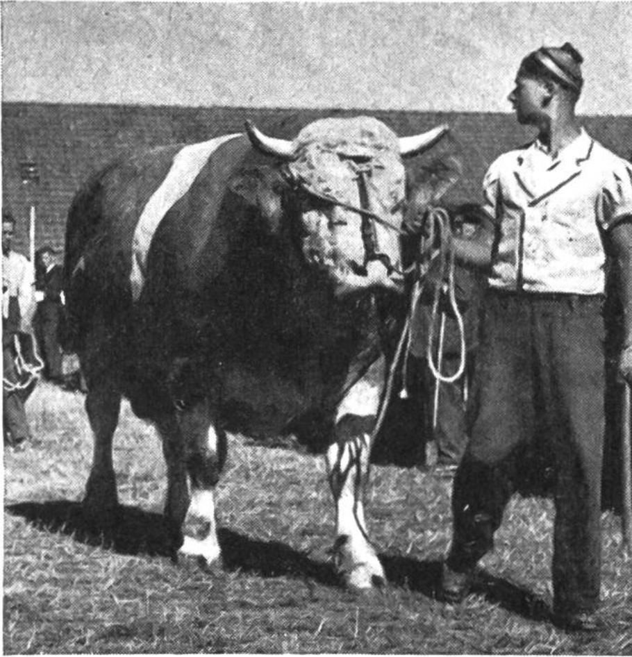
Vorführung eines erstprämiierten Zuchtstiers der Simmentaler Fleckviehrasse.

Rund 180000 Bauernbetriebe halten etwa 1,6 Millionen Stück Vieh, davon ungefähr 900000 Milchkühe.