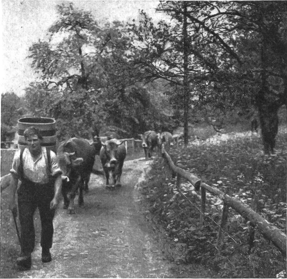
Braunviehherde auf dem Weg zur Frühjahrsweide (Maiensäss).