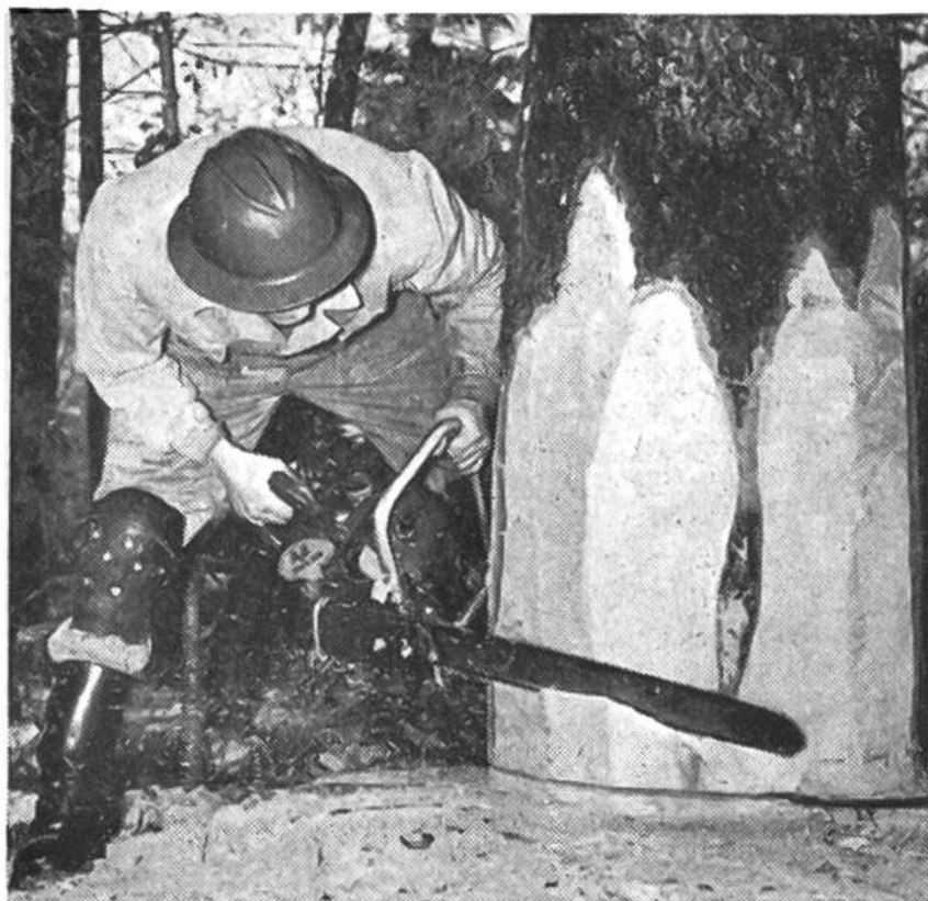
Die neuzeitliche Motorsäge verrichtet rasche Arbeit.

Auf vielen sonntäglichen Waldgängen ist dem Bauern fast jeder Baum seines Reviers vertraut geworden. Auf Grund seiner eigenen Beobachtungen, die er vielleicht noch mit einem geschulten