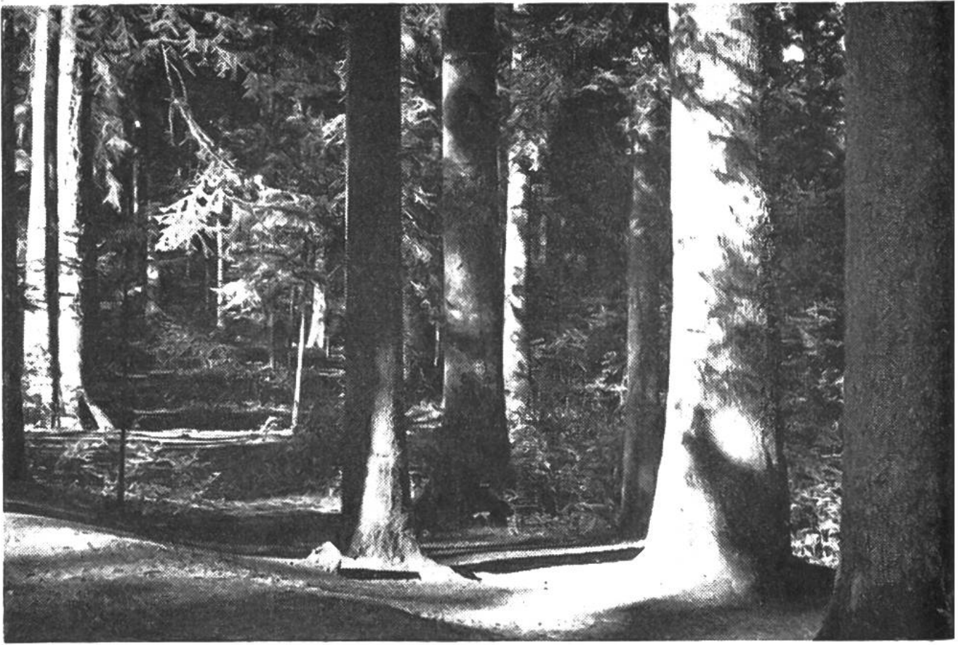
Die in Forstkreisen berühmten dreihundertjährigen Dürsrütitannen im Plenterwaldgebiet von Langnau im Emmental.