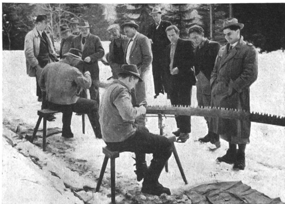
Feilen von Hobelzahnsägen an einem Werkzeugkurs für Waldarbeiter.

Auf vielen sonntäglichen Waldgängen ist dem Bauern fast jeder Baum seines Reviers vertraut geworden. Auf Grund seiner eigenen Beobachtungen, die er vielleicht noch mit einem geschulten