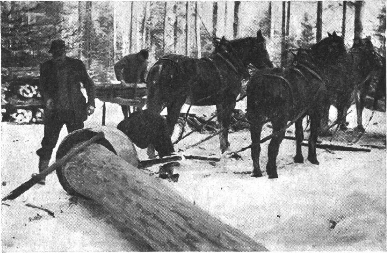
Holzschleifen mit einer Schlepphaube, die das Beschädigen der Wurzelstöcke stehengebliebener Bäume durch den Stamm verhindert.

Brandfall das Bauernhaus oder eine Scheune neu gebaut werden muss oder wenn der durch Seuchen dezimierte Viehbestand erneuert werden sollte. Nur in solchen Fällen wagt sich der sonst sparsame Bauer an das seit vielen Jahren geschonte, wertvolle Starkholz, das ihm nun willkommene Balken und Bretter für den Neubau oder vom Holzhändler das für den Viehkauf nötige Bargeld liefert. A. B.