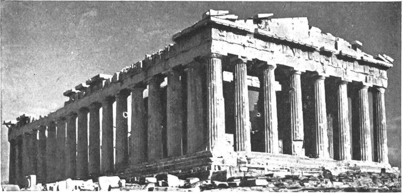
Der Parthenon, erbaut 447–438 v. Chr., das Hauptheiligtum der athenischen Akropolis, ist der Göttin Athene geweiht. Säulenverhältnis 8 : 17.