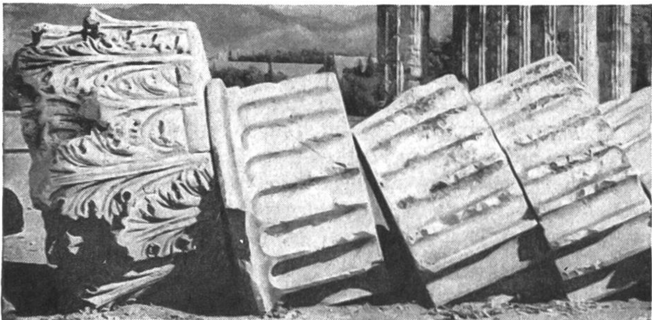
Akanthuskapitell u. Säulentrommeln vom Tempel des olympischen Zeus in Athen.