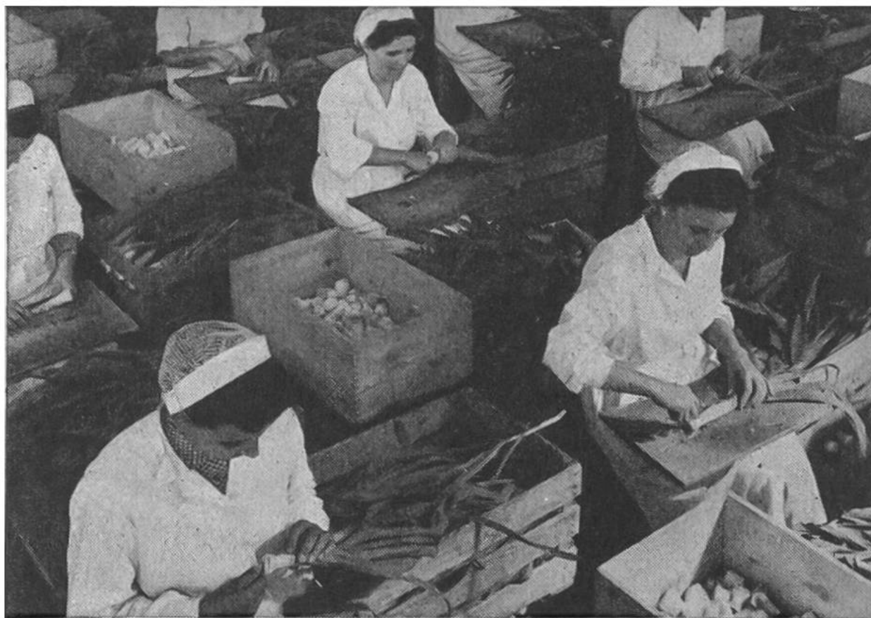
Rüsten von auserlesenem Gemüse.