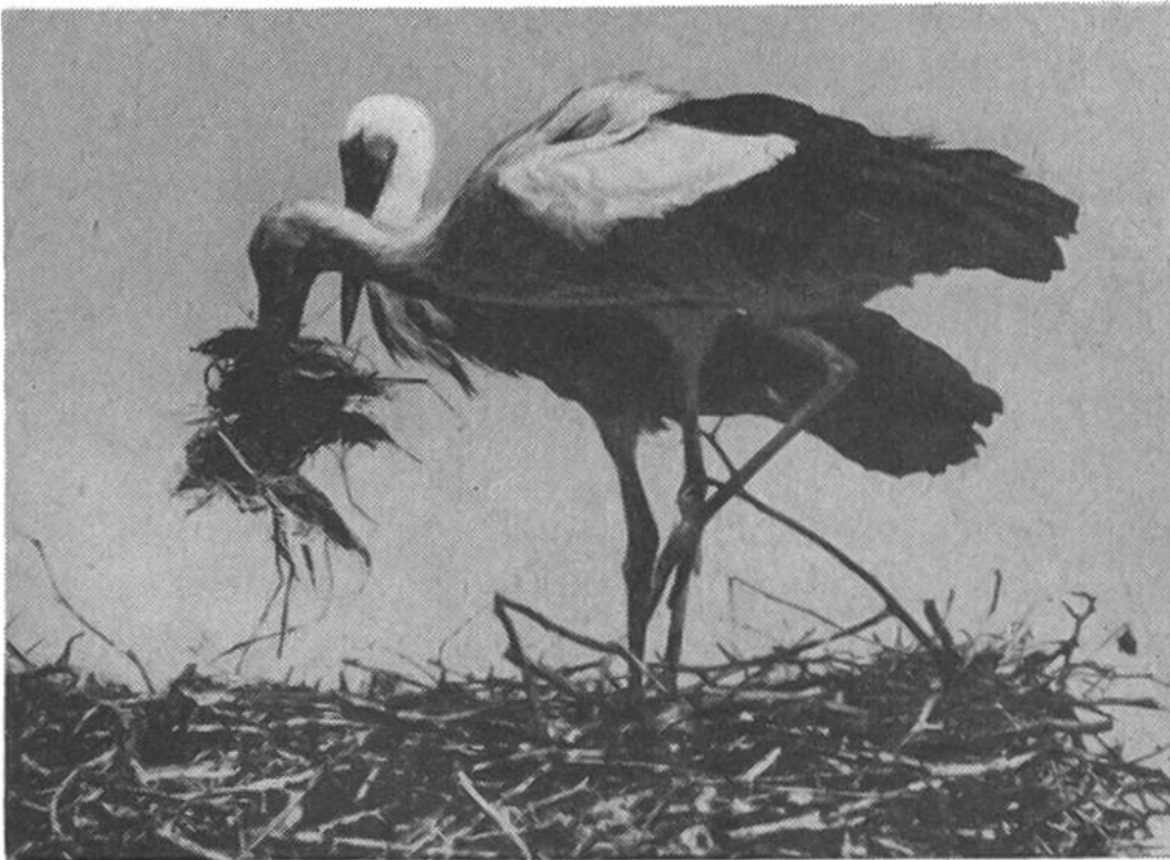
Auf einem Hausgiebel wird das umfangreiche Nest hergerichtet.

Wer heute noch ein richtiges Storchland sehen will, der geht am besten nach Marokko. Dort gilt Adebar als heilig, wird also nicht verfolgt und findet er noch reichlich Frösche und andere Leckerbissen. Auch werden ihm dort Hochspannungsleitungen viel seltener zum Verhängnis als im technisierten Mitteleuropa. H.