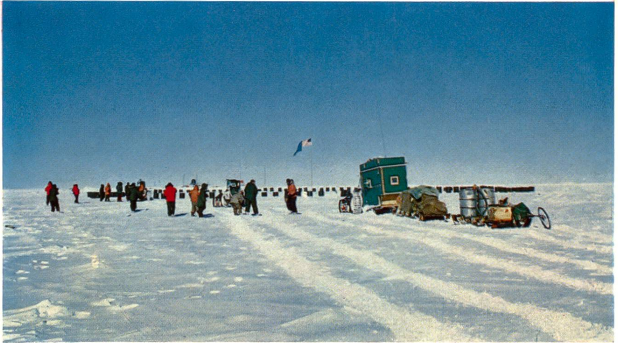
Am 4. Jan. 1958 ist der neuseeländische Teil der Trans-Antarktis-Expedition unter Sir Edmund Hillary nach einer Reise von 1500 km über das Inlandeis am Südpol angekommen. Die Bewohner der amerikanischen Südpolstation haben sich zur Begrüßung bei der Fahne der Vereinten Nationen versammelt. Es ist das erste Mal seit dem 18. Jan. 1912 (Robert F. Scott), dass eine mit Bodentransportmitteln reisende Expedition den Südpol erreicht hat (s. S. 201).