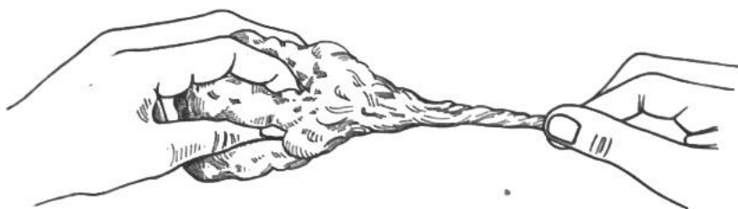
Schematische Darstellung der Herstellung eines Garnes aus einem Baumwollknäuel.

In der Spinnerei muss nun aus diesen Ballen das Garn gefertigt werden. Das geschieht etwa so, wie wenn wir einen Wattebausch von Hand zu einem ganz dünnen Band zerpupfen und es dann drehen. Diese Drehung ist äusserst wichtig, denn dadurch werden