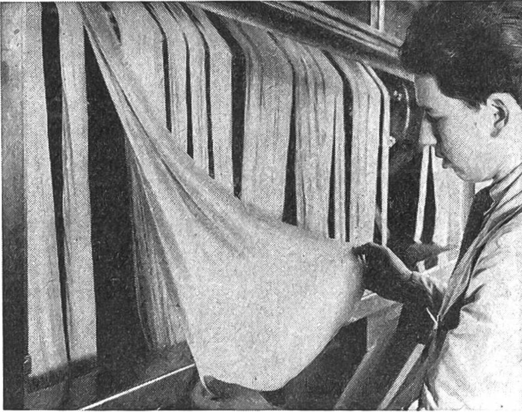
Farbton und Egalität von Trikotstoffen werden auch während des Färbens auf der Maschine laufend überprüft.

seln und Wannen prasselte ein fröhliches Feuer und heizte das Färbebad. Heute stehen Hochdruckapparate aus Edelstahl, der gegen Chemikalien unempfindlich ist, in den hellen, saubereren Betriebsräumen. Temperaturen bis zu 140^{\circ}\text{C} werden angewendet, um die oft widerspenstigen Fasern mit dem Farbstoff zu verbinden, und der ganze Färbeprozess kann vollautomatisch gesteuert werden. Oft sind viele Versuchsfärbungen im Laboratorium nötig, bis das richtige Rezept gefunden ist; es geht ja nicht nur darum, dass das Garn gefärbt ist, auch die wertvollen Eigenschaften dürfen während des Färbens nicht verlorengelassen. So steht denn am Ende aller Behandlungen eine genaue Kontrolle der Echtheiten und sonstigen Eigenschaften. Ständig sind Chemiker und Ingenieure damit beschäftigt, die Rezepte und Behandlungsverfahren zu überprüfen, bessere zu finden und nach Wegen zu suchen, auch die ständig neu entwickelten synthetischen Fasern genau so gut zu färben wie die altbekannten; denn eine neue Faser wird erst dann für die Bekleidung brauchbar, wenn sie auch färbbar ist.