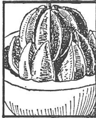
Im Schatzkästlein Seite _____