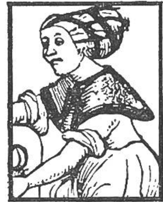
Im Kalender Seite _____