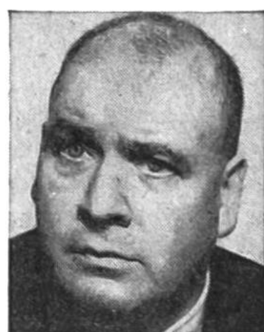
Dr. Jean Bourgknecht von Fribourg * 1902 seit 1960 im Amt