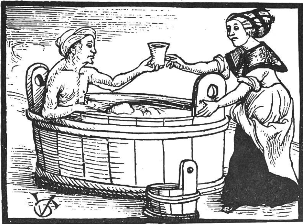
Wasserbad in einem Holzbottich. Holzschnitt von Urs Graf aus: Kalender des Doctor Kung (Kungsberger). Zürich, Hans am Wasen 1508.