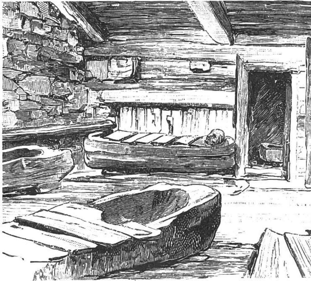
Badstube in Oberkärnten um 1880. Zeichnung von A. Heilmann. Die Badtröge bestehen aus ausgehöhlten Baumstämmen.

mor geschaffen hatten. Man benützte hölzerne Bottiche. Noch um die Mitte des vorigen Jahrhunderts fehlten nicht nur in guten Bürgerhäusern, sondern auch in den Schlössern der Fürsten Badeeinrichtungen. Der deutsche Kaiser Wilhelm I. liess sich jede Woche einmal eine hölzerne Wanne aus einem benachbarten Hotel in sein Schloss bringen, um zu baden. Manchenorts gab es spezielle Geschäfte, die solche Badbottiche ausliehen, in einem Karren vors Haus brachten und nach Gebrauch wieder abholten.