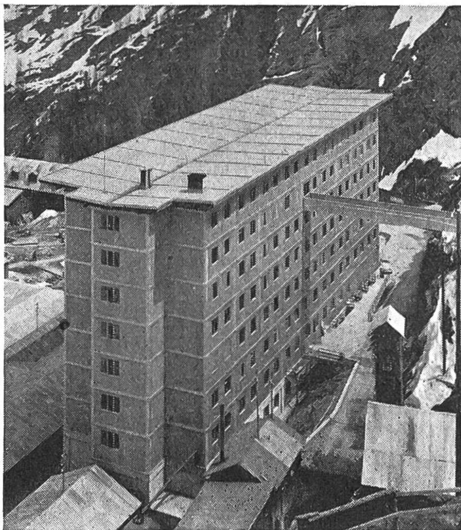
Logierhaus für 450 Arbeiter der Grande Dixence SA auf 2200 m Höhe.

Ein weiterer Vorteil ist die starke Verformbarkeit des Aluminiums. In grossen Pressen werden gegossene Rundbarren aus Aluminium oder Aluminiumlegierungen durch eine Matrize gepresst, deren Öffnung so ausgeschnitten ist, wie der gewünschte Querschnitt des Bauprofils aussieht. Mit diesem Verfahren können Profile beliebiger Form hergestellt werden, so dass sich ein Zurichten und Zusammenfügen an der Baustelle erübrigt. Bei dem wachsenden Mangel an Arbeitskräften und bei den stets steigenden Löhnen für alle handwerklichen Arbeiten ist es für den Bauherrn vorteilhafter, möglichst viele Bauelemente vorfabriziert beziehen und an der Baustelle ohne weitere Mühe einbauen zu können. So spielt das Aluminium als Material für Fassaden und Innenkonstruktionen eine immer grössere Rolle.