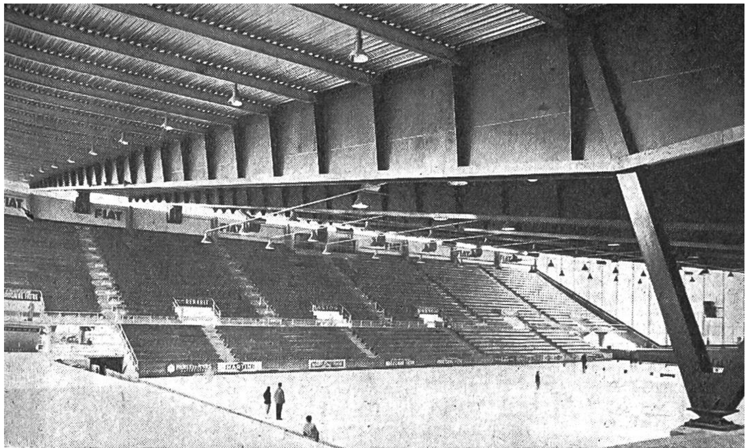
Innenansicht der Kunsteisbahn «Aux Vernets», Genf, mit 10000 Plätzen und 2730 m 2 Eisfläche.

Als man 1954 das Stauwerk «Grande Dixence» im Wallis zu bauen begann, musste man für 450 Arbeiter Unterkunft schaffen. Das Logierhaus sollte den sehr harten Witterungsbedingungen in den Hochalpen gewachsen sein und doch rasch und zu einem mässigen Preis erstellt werden. So hat man für die Fassade vorfabrizierte Platten aus Aluman – einer Aluminiumlegierung – verwendet. Mit ihrem geringen Gewicht belasteten sie die Fundamente wenig und waren leicht zu transportieren und zu montieren; sie waren rostbeständig und widerstandsfähig gegen Feuer, isolierten Wärme und Schall gleich gut und gaben dem Gebäude ein sauberes und ansprechendes Aussehen.