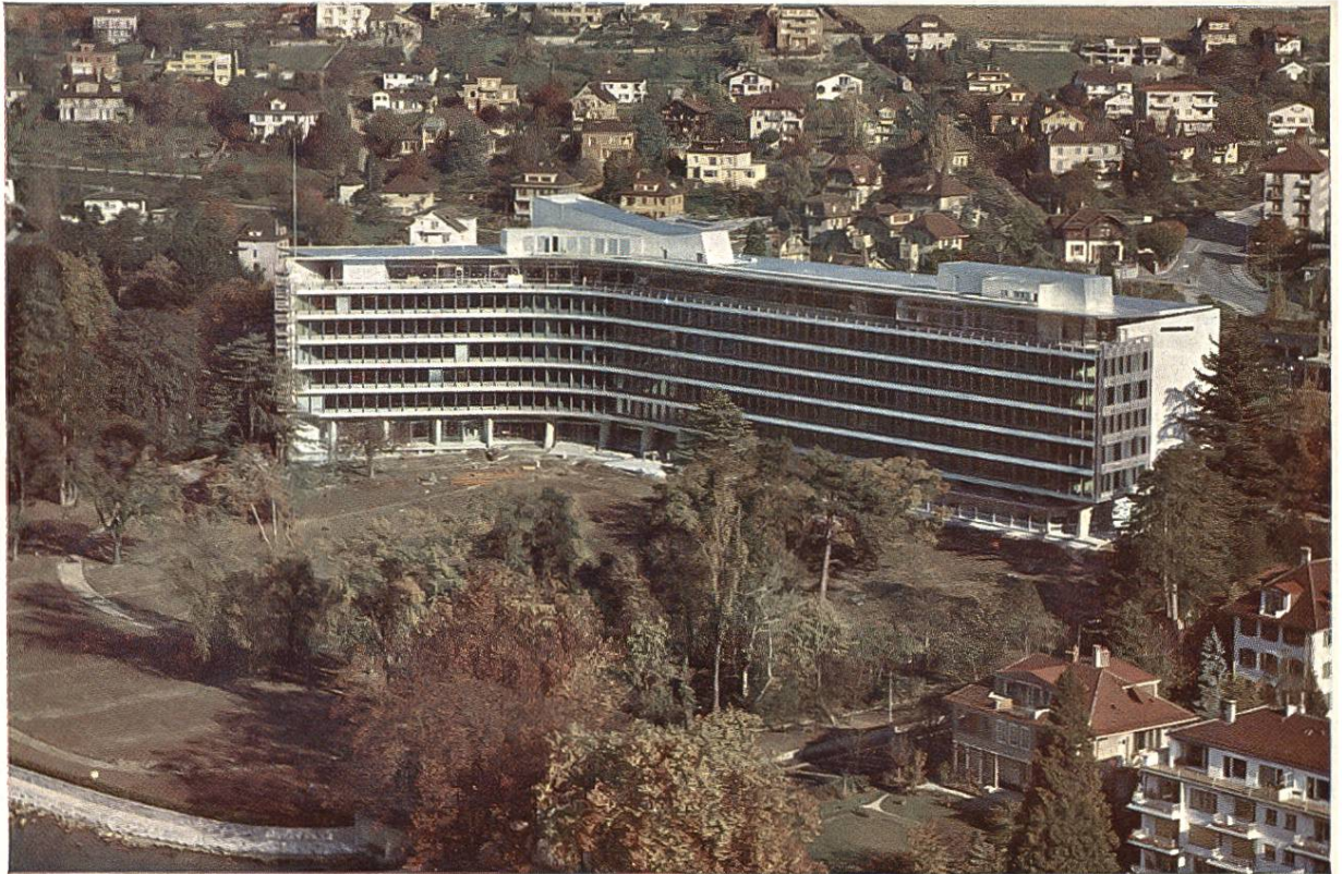
Verwaltungsgebäude der Nestlé Alimentana AG., in Vevey, erbaut 1960 unter Verwendung von 250 t Aluminium für Bedachung, Fassadenverkleidung, Fensterrahmen, Storen, Trennwände, Türen, Treppenverkleidungen.