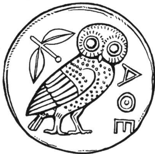
Münze von Athen

415–413 Zug der Athener gegen Syrakus. Alcibiades.