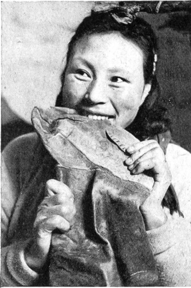
Um die Stiefel aus Seehundsfell weich und geschmeidig zu gestalten, nimmt die Näherin ihre Zähne zu Hilfe.