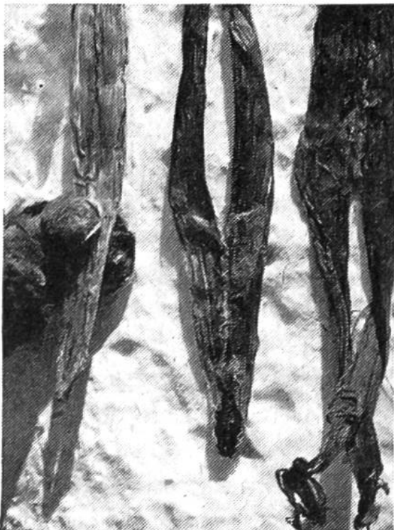
Aus getrockneten Sehnen lässt sich vorzüglicher Nähfaden herstellen.

Zunächst müssen natürlich die Felle der erlegten Tiere behandelt werden. Mit einfachem Gerbverfahren und durch intensives Schaben (zum Teil auch Kauen!) der Innenseite erzielt man wunderbar geschmeidige Felle. Zur Hauptsache ist solche Arbeit eine Aufgabe der Frauen. Diese sind auch vorzügliche Schneiderinnen. Nachdem sie das Fell mit Hilfe eines halbrunden Weibermessers, des Ulo, zugeschnitten haben, nähen sie die einzelnen Teile fest und wasserdicht zusammen; als Faden dienen getrocknete Sehnen. Das Ergebnis sind nicht nur zweckmäßige, sondern vielfach auch schön verzierte Kleidungsstücke.