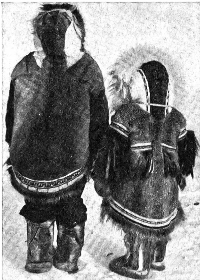
Knabe und Mädchen der Kupfereskimo in Arktisch-Kanada in Fellkleidern, deren schön verzierte Rückenpartie hier zu sehen ist.