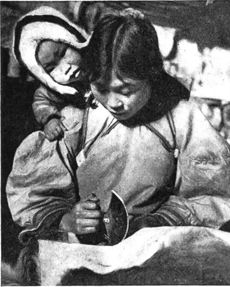
Eskimofrau mit Kind im Rückensack schneidet mit Hilfe des Ulo ein Stück Rentierfell zu.

schickte Lösung gefunden. Sie legen ihrem Winteranzug das Prinzip des Doppelfensters zugrunde; das heisst sie tragen zwei getrennte Kleidungen: eine Unterkleidung (die bei wärmerem Wetter für sich allein genügt) und darüber eine Oberkleidung. Die zwischen diesen beiden Schichten befindliche Luft stellt eine wirksame Kälteisolation dar, da Luft ein sehr schlechter Wärmeleiter ist und somit die Körperwärme zurückgehalten wird. Zudem liegt die Unterkleidung nur lose auf dem Körper auf, so dass der Schweiß verdunsten kann.